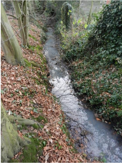
Figuur 3 – Foto van de Oliemeersbeek (7-12-2016).

Het blijft dan ook belangrijk om verder in te zetten op een verbetering van de chemische waterkwaliteit en het aansluiten van huishoudelijk afvalwater op bestaande rioleringsnetwerken waar mogelijk. Alleen wanneer de basiswaterkwaliteit voldoende hoog is, kan herstel van de waterloop succesvol zijn.