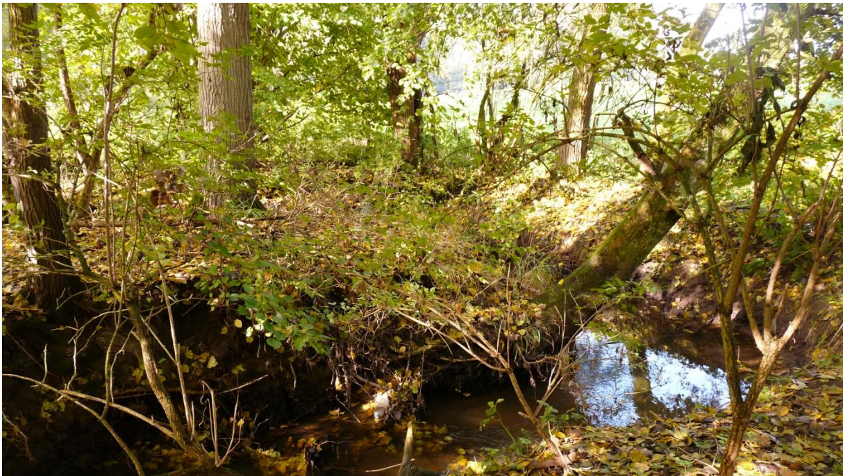
Figuur 1 – Foto van de middenloop van de Molenbeek te Meldert.

De vallei van de Molenbeek-Graadbeek te Aalst vormt de natuurlijke verbinding tussen versnipperde bosgebieden, zoals het Kravaalbos, het Kloosterbos en het Kluisbos. Het beekstelsel heeft nog een sterk met bomen of bosrestanten omzoomde vallei dat als een groen lint door het heuvelachtig landschap van oost naar west slingert om uiteindelijk uit te monden in de Dender. Dit complex beekstelsel kan de resterende en versnipperde boskernen terug met elkaar verbinden. In het project Gestroomlijnd Landschap wordt werk gemaakt van de versterking van deze natuurverbinding, een betere waterhuishouding en de herwaardering van de waterlopen in het landschap. Twee duidelijke restanten van molenstuwten delen deze Molenbeek verder op in verschillende panden. Het beekstelsel heeft echter nog waardevolle en structuurrijke beektrajecten (figuur 1). Reden genoeg dus om terug te zorgen voor een natuurlijk herstel en een vrije migratie van vissen. Voldoende structuur en een geleidelijk herstel van de waterkwaliteit zijn naast een vrije vismigratie de voornaamste voorwaarden voor de verspreiding of herintroductie van een aantal zeldzame of uitgestorven vissoorten.