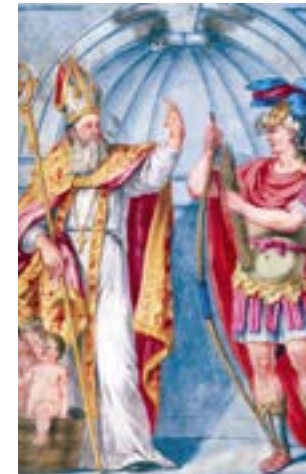
Sint-Niklaas en Sint-Sebastiaan, patronen van schuttersgilde onder: Gegezelde Christus (1630)

Het zuidelijke kruiskoor is bestemd voor de vrije handbooggilde van Sint-Nicolaas en Sint-Sebastiaan, die in 1526 bij octrooi van keizer Karel V gesticht is. Het noordelijke kruiskoor wordt ter beschikking gesteld van de rederijkerskamer De Goudbloem.