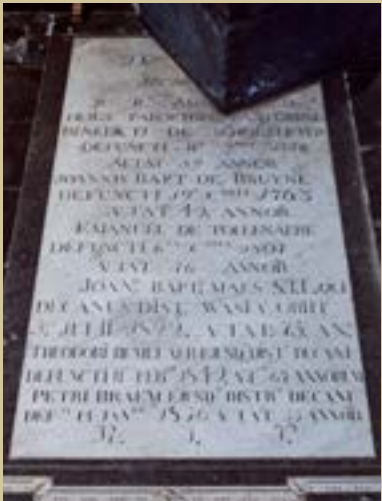
Perceelkaart met dries en kerk anno 1602 Dries met Sint-Nicolaaskerk ca. 1800 Grafsteen pastoors 18de–19de eeuw

Na de levering van nieuwe, houten beelden verdwijnen deze muurschilderingen onder een laag mortel.