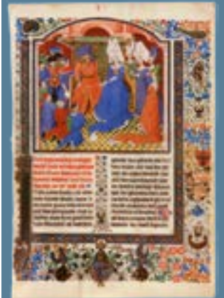
Gravin Johanna van Constantinopel met tweede echtgenoot (1241) onder: Zegel gravin Johanna

De historiek van de Sint-Nicolaaskerk is nauw verweven met het ontstaan en de ontwikkeling van de gelijknamige Wase parochie. In de 12de eeuw is het noorden van het Waasland bedekt met het Koningsforeest , een gemengd loofbos, dat als jachtgebied fungeert voor de graven van Vlaanderen. Ten zuiden van dit woud bevinden zich zogenaamde wastinen , schaars begroeide stuifzandgronden. Nabij zo'n zandrug is Sint-Niklaas ontstaan, aanvankelijk een nog bescheiden nederzetting met enkele woningen, maar gelegen op een strategisch kruispunt tussen Gent en Antwerpen, Zeeland en Brabant. De inwoners zijn gekerstend en moeten hun geloofspraktijk uitoefenen in de parochiekerk van Waasmunster. Velen zien er tegen op om in weer en wind grote afstanden af te leggen om de mis bij te wonen, kinderen te laten dopen, een huwelijk te voltrekken of doden te begraven.