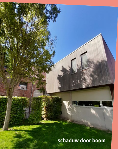
schaduw door boom

Een bijkomend voordeel is dat planten en bomen voor een betere luchtkwaliteit en grotere biodiversiteit zorgen. Deze maatregel is relatief eenvoudig te realiseren en heeft een lage kostprijs.