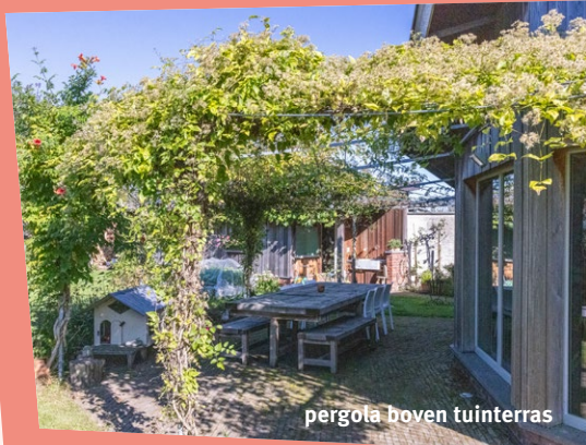
pergola boven tuinterras