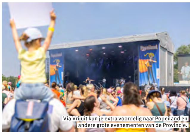
Via Vrijuit kun je extra voordelig naar Popeiland en andere grote evenementen van de Provincie.