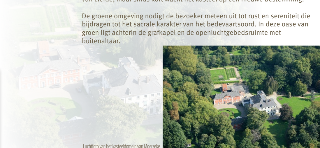
Luchtfoto van het kasteeldomein van Moerzeke

De groene omgeving nodigt de bezoeker meteen uit tot rust en sereniteit die bijdragen tot het sacrale karakter van het bedevaartsoord. In deze oase van groen ligt achterin de grafkapel en de openluchtgebedsruimte met buitenaltaar.