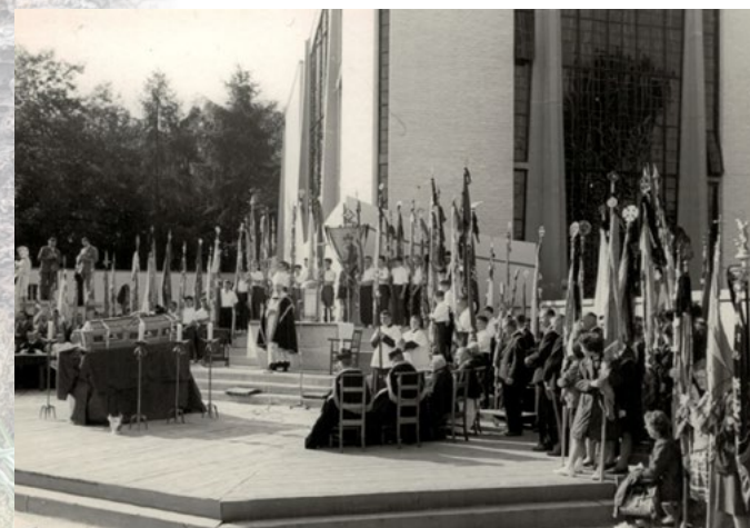
Herbegraving van priester Poppe in de grafkapel in 1962

Op 10 juni 1924 sterft priester Poppe op 33-jarige leeftijd in het klooster van Moerzeke. Onder massale belangstelling wordt hij op 16 juni 1924 begraven op het kerkhof achter het koor van de kerk, onder een eenvoudig houten kruis. Op 9 september 1962 werd zijn stoffelijk overschot herbegraven in de nieuwe grafkapel. Op 27 december 2013 werd het graf van de zalige priester Poppe geopend om te kunnen voldoen aan de wereldwijde vraag naar relieken. De bronzen poort van de begraafplaats, een werk van kunstenaar Maurits De Clercq, werd geplaatst in 2007 en is het sluitstuk van de priester Poppeomgeving, een hedendaags kunstproject met vijf beelden rondom de kerk.