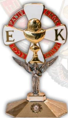
Reliekhouder met een relik van paus Pius X. De symboliek verwijst naar de Eucharistische Kruistocht (EK)