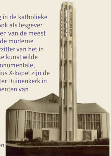
Ontwerpmaquette voor de Onze-Lieve-Vrouw ter Duinenkerk in Koksijde