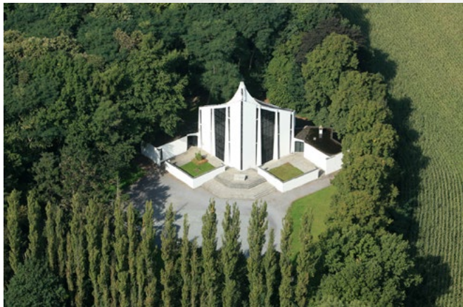
Luchtfoto van de Pius X-kapel