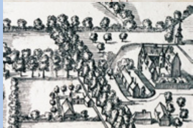
Reconstructie van Hof ter Welle, anno 1550.

De oudste figuratieve afbeelding van Hof ter Welle komt uit het Album de Croy (1602). Aan de zuidzijde is nog een open ruimte te zien, met een eigentijdse tuinaanleg volgens de renaissancemode. Algemeen Rijksarchief Brussel, LA4413