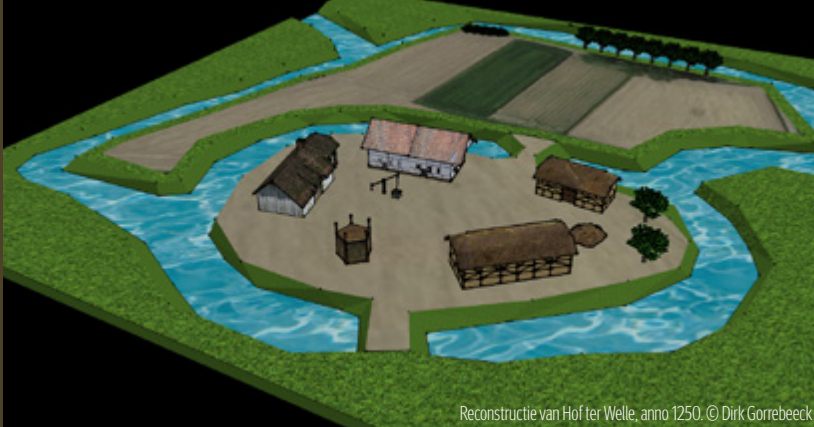
Reconstructie van Hof ter Welle, anno 1250. © Dirk Gorrebeeck

Adellijke bewoners, dienstboden, baljuws, pachters en cijnshouders ruimen plaats voor kloosterzusters, priesters, arme weesmeisjes en pensionaires. Meer dan twee eeuwen zou Hof ter Welle, nu omgedoopt tot Geestelijk Hof, een sociale functie uitoefenen. Hiermee zou de site Hof ter Welle in het collectieve geheugen van de Beverenaars onlosmakelijk verbonden geraken met armenzorg en naastenliefde. In 1988 verlieten de laatste zusters Hof ter Welle. Een belangrijk hoofdstuk in de geschiedenis van het kasteel werd hierdoor afgesloten.