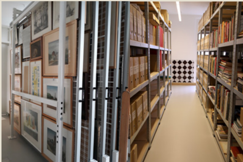
Het kunstdepot bewaart in totaal zo'n 1500 collectiestukken uit het gemeentelijk kunstpatrimonium.

Geïnteresseerden in volkskunde, heemkunde en geschiedenis kunnen terecht in de erfgoedbibliotheek van de Hertogelijke Heemkundige Kring Het Land van Beveren. Deze zeer ruime bibliotheek bevat enkele duizenden publicaties en tijdschriften over de lokale geschiedenis van Beveren en de regionale geschiedenis van het Waasland. Ook archiefstukken, kranten, foto's, bidprentjes en andere geschiedkundige documentatie worden via deze bewaarbibliotheek ontsloten.