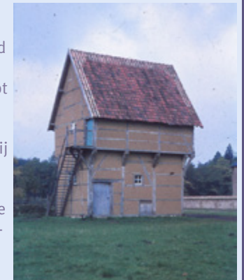
Een voorbeeld van dit type spijkertoren (uit Diepenbeek) is vandaag nog terug te vinden in het Openluchtmuseum van Bokrijk. Toekomstig onderzoek zal echter moeten uitwijzen of het mogelijk is een reconstructie te maken van de oorspronkelijke toren van Hof ter Welle.

In de noordoostelijke hoek van het kasteel Hof ter Welle bevindt zich een zeer oude houten kern. Oude moer- en kinderbalken, het vakhoutwerk en de dakoverspanning zijn vandaag nog zichtbaar en leveren stof voor een levendige discussie. Eerst werd gedacht dat het houtskelet het restant vormde van een houten donjon of woontoren, die aanvankelijk volledig in hout opgetrokken was en nadien gedeeltelijk versteend geraakte. De beperkte afmetingen van de toren trekken die stelling echter in twijfel. De toren in vakwerk had bovenaan een overkraging. Bij de restauratie waren de houten spanten nog deels zichtbaar. In het latere metselwerk werd op de benedenverdieping een prachtige laatgotische schouw ingewerkt die doorloopt over de twee bovenverdiepingen. Dendrochronologisch onderzoek, op basis van de jaarringen in het hout, zou kunnen helpen bij een relatieve datering van de ouderdom van het houtwerk. Een actuele hypothese is dat de toren op de oorspronkelijk omwalde hoeve als een spijker functioneerde met een woongedeelte voor een pachter op de benedenverdieping en een (graan)opslagplaats of spijker (Lat. > spicae : korenaren) op de hogere verdiepingen, een idee dat spoort met de economische exploitatiefunctie van het middeleeuwse domein van Ter Welle.