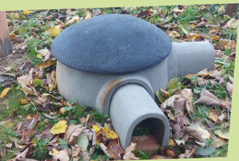
Egelburcht in de tuin van het Faunahuis

Het is van belang deze soorten te beschermen aangezien ze bijdragen tot onze biodiversiteit en een leefbare woonomgeving (sommige vleermuizen kunnen in één nacht wel 3000 muggen vangen!).