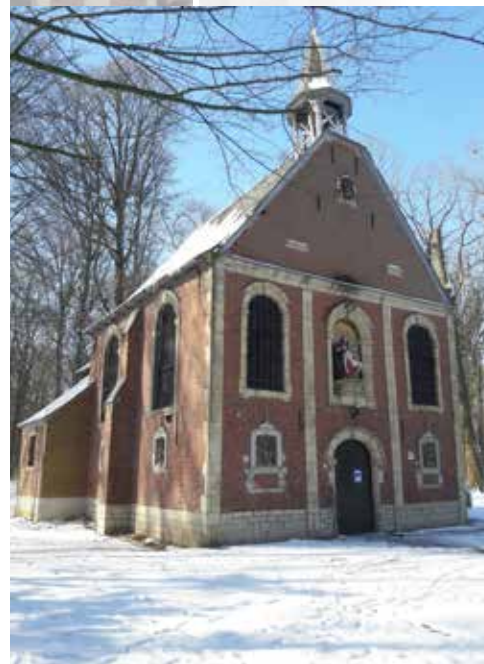
Boskapel in Buggenhoutbos