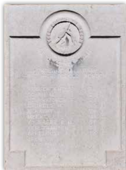
Gedenksteen aangebracht aan het gemeentehuis van Sinaai, ter herdenking van de Boerenkrijg, met vermelding van de namen van de gesneuvelden

In 1973 werd op initiatief van het Davidsfonds Sinaai, ter gelegenheid van de 175ste verjaardag van de Boerenkrijg, aan de muur van het gemeentehuis van Sinaai een rechthoekige arduinen gedenksteen aangebracht. Bovenaan is een medaillon gebeeldhouwd. In de rand ervan staat Voor outer en heerd 1798 . Centraal in het medaillon staan twee personen, waarvan een gedeeltelijk achter een Boerenkrijgsvlag verscholen gaat. Onder het medaillon staat gebeiteld, waarbij de eerste zin de ronding van het medaillon volgt: de gemeente Sinaai · herdenkt dankbaar · wie hier gedood werden.