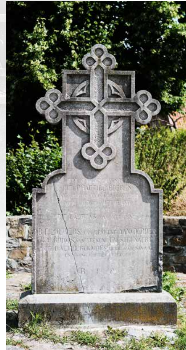
Herdenkingskruis met betrekking tot de gevechten in de wijk Kleibeeck links: Detail van de tekst op het herdenkingskruis