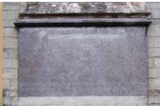
Gedenksteen aan de gevel van de Sint-Jacobus de Meerderekerk te Haasdonk