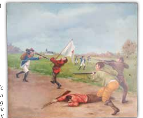
boven: Boerenkrijgbank aan de Sint-Elooistraat onder: Detail van de tafereelschildering op de Boerenkrijgbank