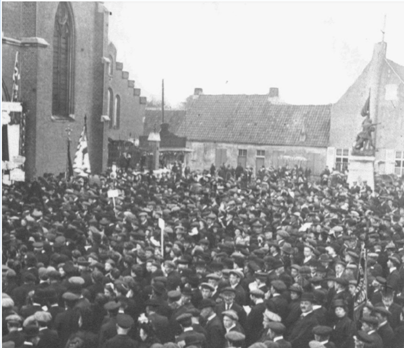
1898 · 100 jaar Boerenkrijg