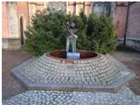
Het standbeeld en fontein van Amelberga Truyman op de Markt

haar smeekbede maar tegelijk ook de kwetsbaarheid van de bevolking tegenover de Franse overheersing. De uitgestrekte arm is een smeekbede voor vrijheid en rust, terwijl het water loutering en bevrijding symboliseert.