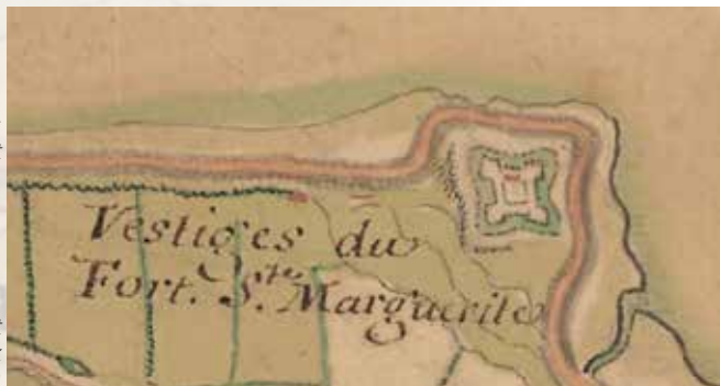
boven: Buggenhoutbos