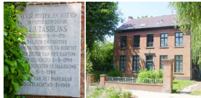
Gedenkplaat aan het woonhuis van Johannes Baptist Tassyns © Dirk Verelst, Heemkundige Kring Zwijndrecht-Burcht

boven: Gedenkplaat aan de Richard Orlentstraat, op de plaats waar pastoor Michael Franciscus Cop werd aangehouden © Dirk Verelst, Heemkundige Kring Zwijndrecht-Burcht