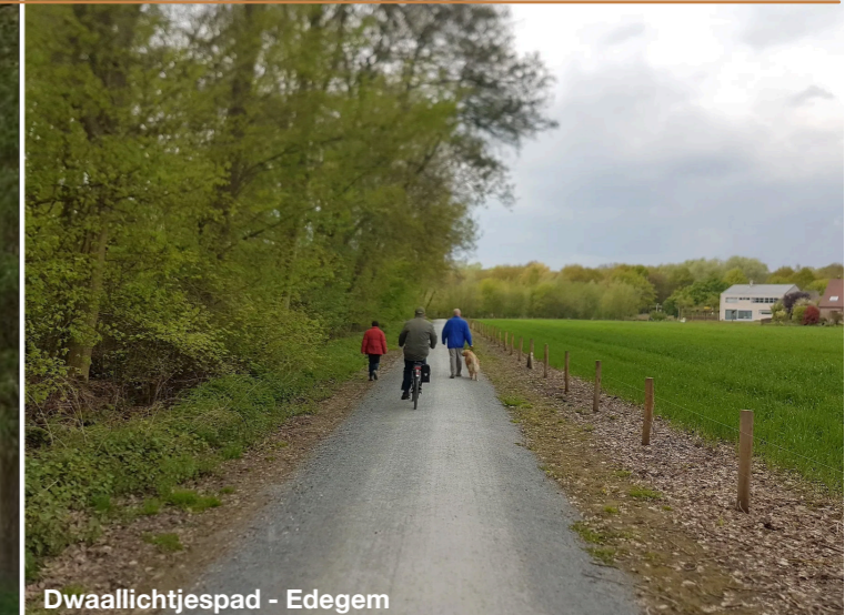
Dwaallichtjespad - Edegem