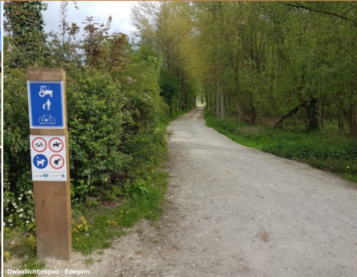
Dwaallichtjespad - Edegem