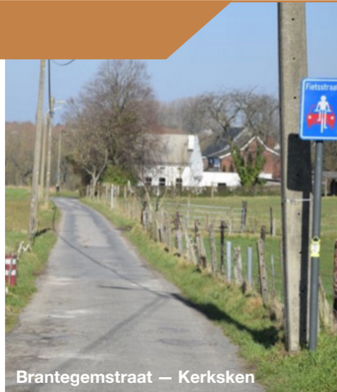
Brantegemstraat — Kerksken