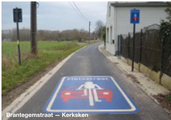
Brantegemstraat — Kerksken