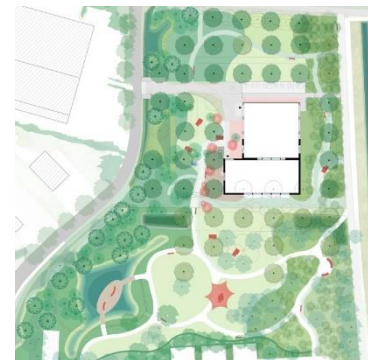
Voorbeeld van een ontwerpplan