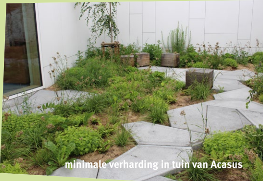
minimale verharding in tuin van Acasus

Bijna 29% van de totale oppervlakte van Vlaanderen is bebouwd , en die oppervlakte neemt nog jaarlijks toe. Bijna de helft ervan is verbonden met 'wonen'. Vlaanderen heeft met 16% de 2 e hoogste verhardingsgraad van Europa. We moeten absoluut nieuwe verhardingen vermijden , zoveel mogelijk beperken , en zelfs gaan ontharden .