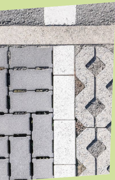
diverse waterdoorlatende verharding

De verdroging leidt – vooral in gebieden met kleigrond – zelfs tot verzakkingen en scheuren in woningen . En tenslotte versterkt al die verharding het stedelijk hitte-eiland-effect waardoor in bebouwd gebied de temperaturen hoog kunnen oplopen en het er 's nachts moeilijk afkoelt.