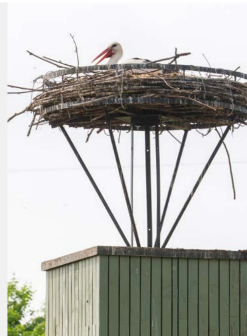
Door de ooievaars te ringen, kunnen we hun bewegingen volgen.