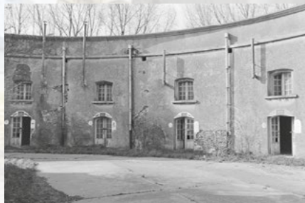
Detail van de kat aan landzijde, 1981. De verwijzingen naar het Belgisch leger zijn nog duidelijk zichtbaar.

Tijdens graafwerken op de site werden in 1983 meer dan honderd pijpenstelen en pijpenkoppen teruggevonden. De ontdekkingsreizen omstreeks het midden van de 16de eeuw brachten tabak naar Europa. Het roken van kleipijpen groeide uit tot een populair gebruik dat zich razendsnel verspreidde onder de burgerbevolking maar ook onder soldaten. De pijpenstelen hadden een lengte tot wel 40 centimeter, waren fragiel en braken snel. De gebroken stelen werden weggegooid. Enkel de pijpenkoppen bleven intact. Van de 120 gevonden pijpenkoppen is 85% te herleiden tot de periode 1600–1750, toen er op het fort een Staatse bezetting aanwezig was.