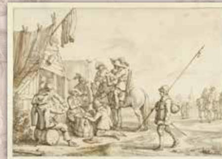
Pijprokende Staatse soldaten en burgers, achttiende eeuw

Aanvankelijk lag op het dak een dikke laag aarde. Er is plaats voor twaalf kanonnen. Omdat de Fransen de wallen rond het fort ophoogden, was de kat zelf veilig voor beschietingen. De schietgaten zitten aan de Scheldekant. Aan de landzijde zitten de deuren, die toegang boden tot het exercitieterrein.