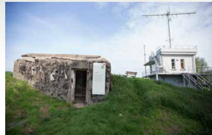
Een Duitse bunker en de uitkijktoren van de Belgische zeemacht op de dijk van het fort.