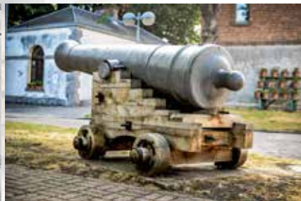
Vroegnegentiende-eeuws Frans kanon voor de kat