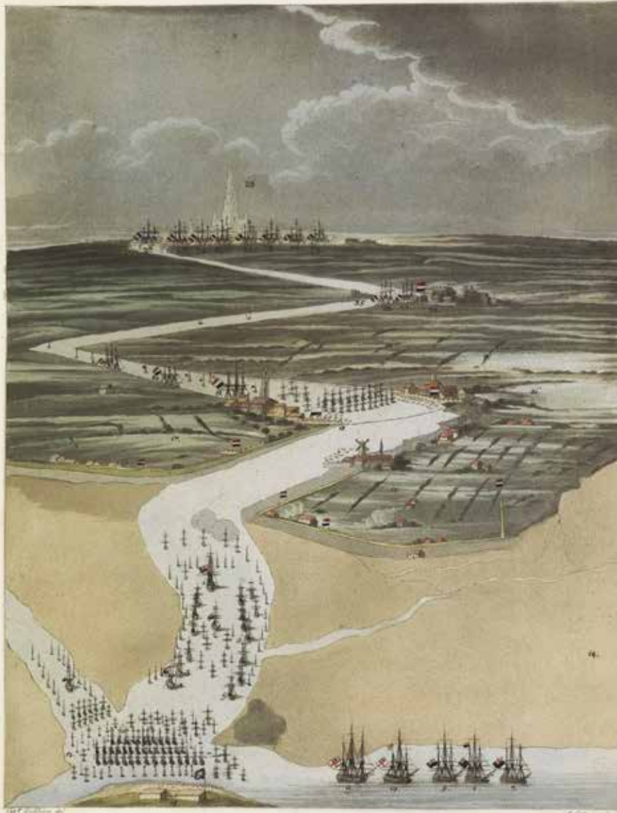
SCHILDKRACHTIG PLAN VAN DE GROOTE EXPEDITIE, OP DE WRSTER-SCHIEDEN, IN AUGUSTUS 1809; aantewende de moeijelijkheid van het andersz tot ANTWERPEN.