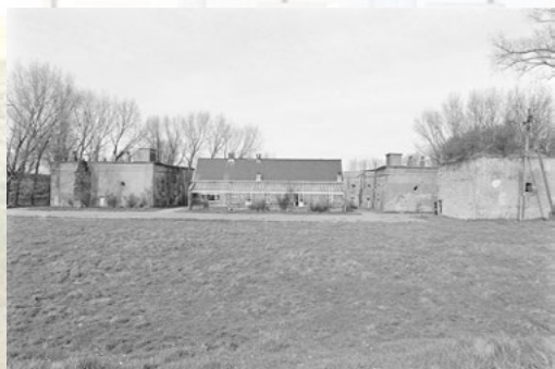
Het ziekenpaviljoen met veranda in de besmette zone, 1981

Onmiddellijk na de Eerste Wereldoorlog werd het fort verbouwd tot lazaret van de quarantainedienst. Op het vroegere exercitieterrein werd een paviljoen opgetrokken om de ernstig zieke en stervende opvarenden van besmette schepen te verzorgen. In november 1980 werd het vervallen paviljoen afgebroken. Tussen het paviljoen en de tien ziekenzalen aan de linkerkant van de kat was een muur opgetrokken om de besmette patiënten te scheiden van de herstellenden. Het tracé van de muur is nog te volgen in het grasveld.