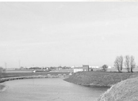
Op de dijk flankerde een herberg lange tijd de steiger voor de veerdienst

De officierswoning is opgetrokken in de Franse periode om de hogere graden van het garnizoenskorps in te kwartieren. In de Staatse tijd stond op diezelfde plaats een kerk. De officierswoning werd in de loop der jaren verschillende keren verbouwd. Omstreeks 1905 kreeg het een verdieping. In de quarantaineperiode was de officierswoning het administratief hart van het lazaret van de quarantainedienst van de Schelde. De geneesheer en de verplegende staf logeerden hier. In de jaren 1960 en 1970, toen de site geen defensieve functie meer had, fungeerde het gebouw als vakantiewoning voor de gezinnen van Belgische militairen.