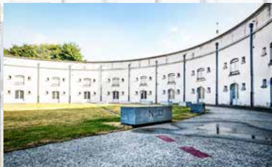
Het exercitieterrein anno 2022 met op de voorgrond het rode tracé van de quarantainemuur