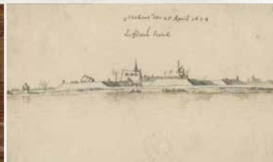
Valentijn Klotz, Zicht op Liefkenshoek, 1674. De kerktoeren staat prominent afgebeeld