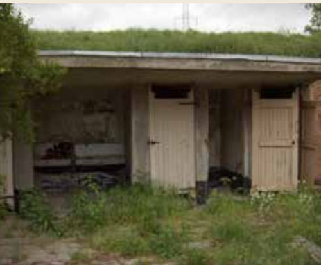
De quarantainelatrines in 2007

De Belgische overheid gebruikte het fort Liefkenshoek tussen 1849 en 1952 als afzonderings- en herstellingsoord voor opvarenden van schepen getroffen door besmettelijke ziektes. De grote stoomschepen die Antwerpen bevoorraadden met overzeese goederen en de passagiersschepen die emigranten uit alle hoeken van Europa met honderden tegelijk naar het Amerikaanse continent brachten, moesten hier voorbij. Aangezien het fort op veilige afstand van de bewoonde wereld lag, was het een geschikte plek om zieken te verzorgen en gezonden in observatie te houden zonder de