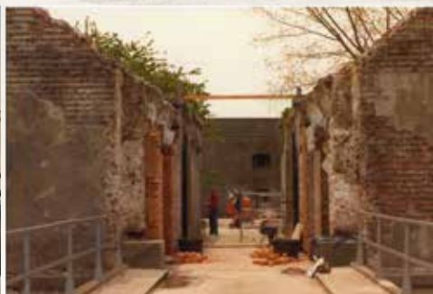
De restauratie van de boog van de toegangspoort in 1984