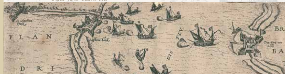
De forten Liefkenshoek en Lillo, op beide oevers van de Schelde. Detail uit Frans Hogenberg, ‘De vernietiging van de brug van Farnes’ © Museum Plantin Moretus Antwerpen

Tussen 1568 en 1648 woedt in de Nederlanden een burgeroorlog. Het volk heeft de wapens opgenomen tegen zijn vorst, Filips II. Deze laatste heerst niet alleen over de Lage Landen, maar over een wereldrijk, geërfd van zijn vader keizer Karel V. Filips II opereert met zijn regering vanuit Spanje en voert een centraliserende politiek en een repressief katholiek beleid. De Nederlandse edellieden, die zich uitgesloten voelen van de macht, zoeken aansluiting bij het gewone volk dat zwaar te lijden heeft onder een aanhoudende economische crisis. Alle bevolkingsgroepen snakken bovendien naar godsdienstvrijheid: vrijheid om een geloof te kiezen en te belijden, zonder daarvoor vervolgd en bestraft te worden. Deze mix van onmacht, onvrede en onrust, vormt een kruitvat dat in 1566 explodeert. In Steenvoorde (nu Frans-Vlaanderen) wordt de inboedel van een kerk na een hagenpreek aan diggelen geslagen en geplunderd. Het is de aanleiding voor de Beeldenstorm, die als een vuurtje over de Lage Landen loopt. Als gevolg van de repressie die erop volgt, breekt een burgeroorlog uit, de Tachtigjarige Oorlog.