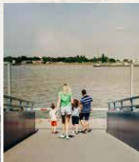
Wachten op DeWaterbus op de nieuwe steiger van het fort Liefkenshoek