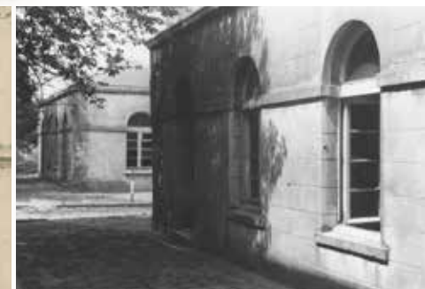
De poortgebouwen in 1981