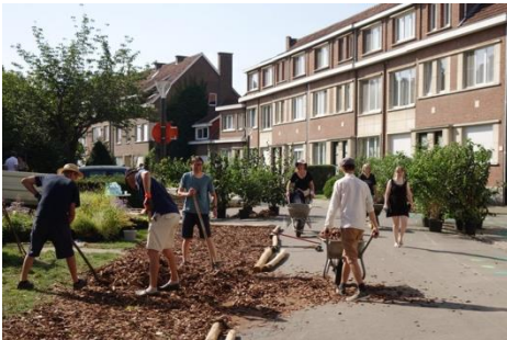
Redingenhof, Leuven: In deze buurt nemen bewoners zelf de ontharding en het groen in hun straten in handen.

Grote veranderingen zijn een goede aanleiding om meer samen te werken en ontmoeting te stimuleren tussen jong en oud, buurtbewoner en sitegebruiker. Samenwerken kan door goede afspraken te maken over onderhoud en beheer, gezamenlijke activiteiten, maar ook het delen van ruimtes en infrastructuur zoals keukens, polyvalente zalen, fietsenstallingen, deelwagens, parkeerplaatsen en meer. Ook in onze groene ruimte kunnen we meer delen: door trage wegen door het gebied aan te leggen, tuinen en speelplaatsen toegankelijk te maken voor omwonenden of buurtmoestuinen en sportvoorzieningen te plaatsen. Zo werken we een aan deelcultuur langs de Schelde.