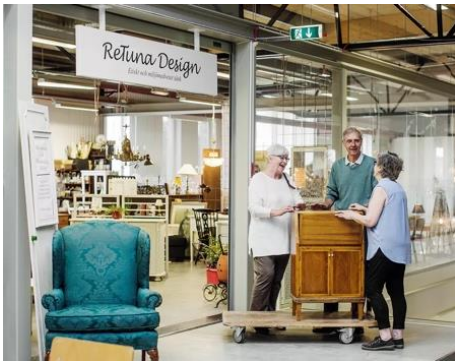
Retuna in Eskilstuna, Zweden: Een circulaire hub voor tweedehandse, gerecycleerde en opgeknapte producten.

Heel wat van de partners op de site hebben nood aan een nieuw of ruimer gebouw. Het ontwerpteam onderzoekt hoe we zoveel mogelijk de bestaande gebouwen en materialen kunnen hergebruiken. Nieuwe gebouwen moeten materiaalbewust en zo compact mogelijk gebouwd worden. Zo verkleinen we de impact op het klimaat en het milieu. In deze circulaire aanpak zitten heel wat kansen voor buurtbewoners: leegstaande ruimtes kunnen tijdelijk ingevuld worden als buurtatelier, ontmoetingsruimte of materialenbank. Water wordt zo veel mogelijk opgevangen en hergebruikt. Ook de open ruimte krijgt meerdere functies: biodiversiteit stimuleren, natuurlijke spelelementen, waterberging, verkoeling, ... Warmte en energie kunnen gedeeld worden tussen de grote instellingen en de buurt.