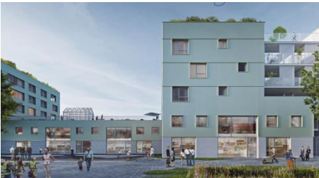
Nova City, Brussel: Dit project is een voorbeeld omdat het wonen combineert met flexibele en productieve programma's op de benedenverdieping.

Tenslotte denken we na hoe de combinatie van wonen en werken de site nieuw leven kan inblazen. Wetteren heeft een productieve geschiedenis, vol van makers, telers en bouwers die we graag in de verf zetten en stimuleren. Daarom kijken we hoe bedrijvigheid en maakplekken hier een plaats kunnen krijgen en hoe deze ruimte mee gebruikt kan worden door de technische scholen en omwonenden. Zo maken we een plek die overdag en 's avonds bruist van experimenten, productie en leven.