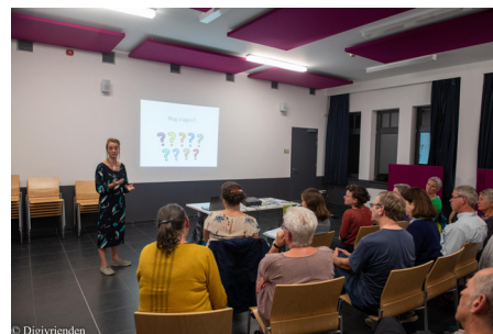
Infosessie Steenokkerzeel