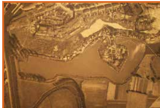
Luchtfoto van Bastion VIII voor de sloop van de gebouwen in 1934

Na de zware verwoesting van Dendermonde tijdens de Eerste Wereldoorlog – de stad was een van de zeven Belgische ‘martelaarssteden’ – bouwden in 1919 en 1920 het Rode Kruis en het Koning Albert Fonds noodwoningen op de voormalige militaire gronden om tegemoet te komen aan de enorme woningnood in de stad. In totaal werden het er 526. De vijf woningen die nog te zien zijn aan het Nieuw Kwartier bij Bastion VIII zijn er de laatste getuigen van. Oorspronkelijk waren de woningen houten barakken, maar in de loop der tijd werden ze verbouwd. Zo kregen ze vaak stenen buitenmuren, waardoor de oorspronkelijke houten barakken niet meer herkenbaar zijn.