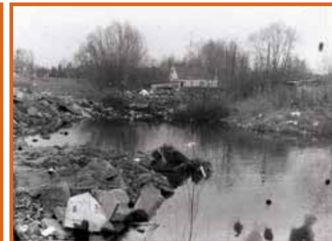
De stortplaats in de jaren 1960

In 1936 werd de stad Dendermonde eigenaar van Bastion VIII. Het terrein werd herbestemd als een stortplaats voor inerte materialen (materialen die geen bodembedreigende stoffen of afvalstoffen lekken). Om daar ruimte voor te maken werd de hoofdgracht gedempt en de kat met zijn bomvrij poeder- en artilleriemagazijn afgebroken. In 1974 werd ook het gebouw aan het terreplein afgebroken. Rond 1985 kwam het terrein door een ruil in bezit van het gemeenschapsonderwijs, maar het stadsbestuur en de omwonenden bleven het als stortplaats gebruiken.