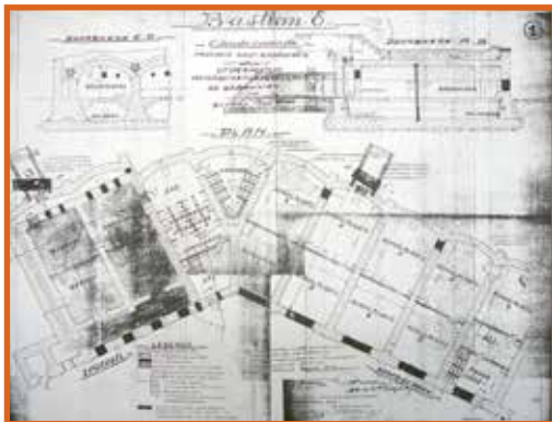
Plattegrond van de kazernegebouwen op Bastion VIII, 1939 (Stad Dendermonde)

De huidige bloemenweide is het vroegere terreplein, een woord dat is afgeleid van het Franse 'terre-plein'. Het ging om een vlak terrein binnen een bastion, fort of vesting. Deze plek gebruikte de infanterie van het leger in de 19de eeuw als wapen- en oefenterrein. Ook de plaatselijke burgerwacht, een gemeentelijke milizie die geen deel uitmaakte van het reguliere leger, oefende er op zondagmorgen.