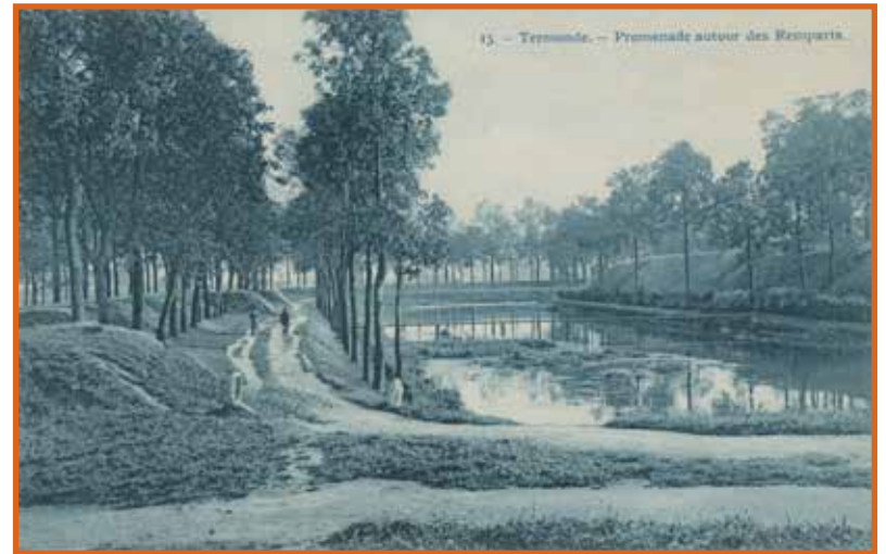
Wandelaars aan de Brusselse forten, begin zoste eeuw

Bastion VIII is vandaag de dag een provinciaal centrum voor natuur- en milieueducatie. Van de middeleeuwen tot nu heeft het domein een rijke geschiedenis achter de rug. De naam 'Bastion VIII' verwijst naar de historische functie: dit was een onderdeel van de vestinggordel rondom het stadscentrum van Dendermonde.