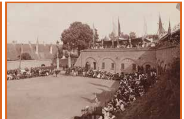
Feest op het terreplein, de toeschouwers zitten voor het kazernegebouw, 1906

Hier bevond zich ook het hoofdgebouw van het bastion, waar de manschappen verbleven en de schuilplaatsen waren. Het gebouw stond vroeger in verbinding met de twee holtraversen verder op het terrein, via een gang in de aarden omwalling.