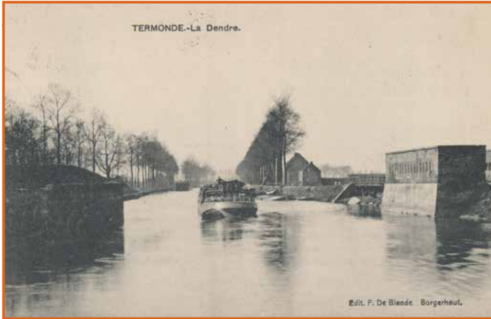
Oude postkaart van de toegang van de Dender in de stad, met links en rechts de vestingwerken.