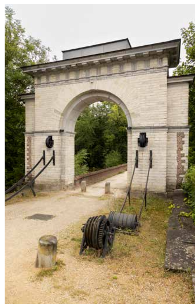
De Brusselse poort in Dendermonde, ontworpen door Cornelis Alewijn ca. 1822

Groot-Brittannië en de Nederlanden stortten elk twee miljoen pond. Frankrijk moest als oorlogsbijdrage 60 miljoen Franse frank betalen, al werd die som vermoedelijk nooit volledig uitgekeerd.