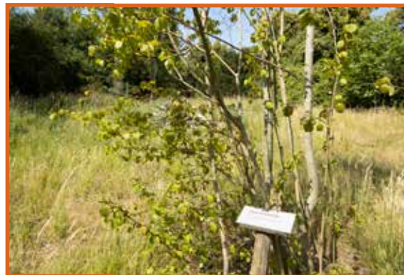
De bloemenweide op het terreplein