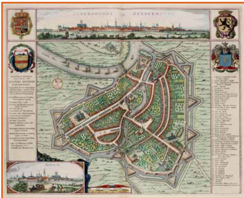
De vesting Dendermonde in 1649, uit de Grooten Atlas van Johannes Blaeu (Amsterdam, Scheepvaartmuseum)

In dezelfde periode (1584–1590) werd op de landtong tussen Dender en Schelde een driehoekige citadel opgericht (het zogenaamde ‘Spaans Kasteel’), met hieraan gekoppeld een ingenieus sluizensysteem dat in 24 dagen tijd de omgeving over een breedte van 400 meter onder water kon zetten. Inundaties waren een typisch en succesvol element in de verdediging van steden in de Lage Landen.