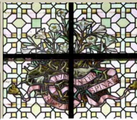
Zijaltaar Maria