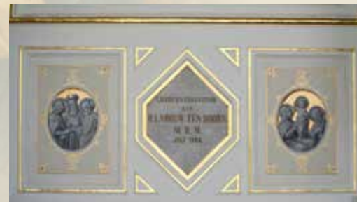
Zijaltaar H. Jozef