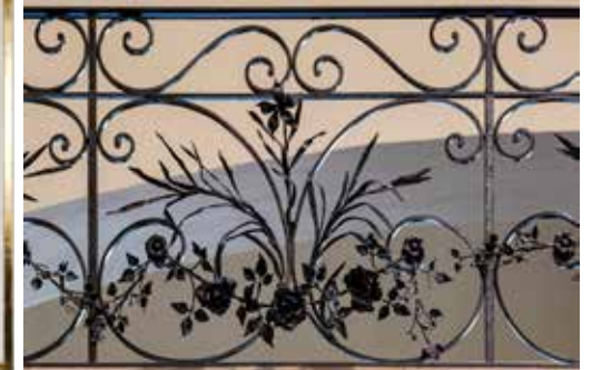
Detail balustrade

Alfons Oosterlinck was niet alleen huisschilder maar vooral een gewaardeerd kopiist van 17de-eeuwse meesters. Met de twee grisailles rechts van de preekstoel (de twee stenen tafelen van de tien geboden en het kruis) bracht hij in 1956 meer symmetrie in de zuidelijke muur.