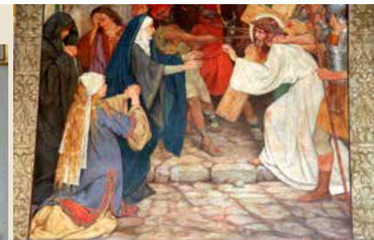
De kruisdraging Wante