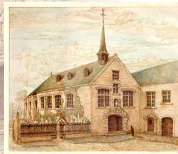
Zo zag de kapel eruit in de periode van de Recollecten

Nadat Kanunnik Triest in 1803 de congregatie van de Zusters van Liefde J.M. had gesticht, richtte hij in vrij snel tempo nieuwe communiteiten op. In 1820 kocht hij de site van Onze-Lieve-Vrouw-ten-Doorn en investeerde flink in de restauratie. Toch kreeg hij niet onmiddellijk de toelating er een klooster te stichten. In 1832 werd ons stadsbestuur verplicht preventief voor opvang van cholera-patiënten te zorgen. Omdat het klooster in de Zuidmoerstraat de enige geschikte locatie leek, zochten ze hulp bij de kanunnik. Die stuurde op 10 mei 1832 de eerste twee zusters naar Eeklo.