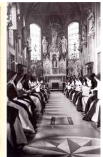
Zusters van Liefde tijdens het officiegebed