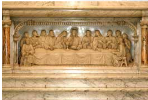
Het laatste avondmaal