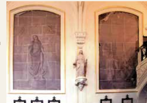
Grisailles Karel Smitz © Stadsarchief Eeklo

Toen men bij de restauratie in 2004 de doeken van Ernest Wante van de muur haalde, kwamen drie grisailles vrij. “ Jezus en de Samaritaanse vrouw in een bijbels landschap ” (eerste nis) was volledig afgewerkt en gesigneerd “ Karel Smitz 1880 ”. “ Maria op een maansikkel ” (derde nis) wilde de schilder waarschijnlijk nog verder afwerken, want een decor ontbreekt. In de vierde nis is enkel de vage aanzet van een ontwerp te zien. Ter bescherming werden de grisailles met Japans rijstpapier afgedekt. Ze zitten nog steeds onder de schilderijen.