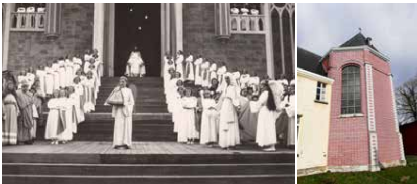
500 jaar Onze-Lieve-Vrouw-ten-Doom 1948

In 1682 konden de Paters Recollecten eindelijk de westgevel van de kapel afwerken. In de eerste drie stenen door de Gardiaan (kloosteroverste) gelegd, was telkens een naam gegrift, nl. Jezus, Maria en Franciscus. Op de gevel werd ook het wapenschild van de Eeklose heer, de la Faille, aangebracht. Door de bouw van de belpoort verdwenen deze speciale stenen echter onder het pleisterwerk.