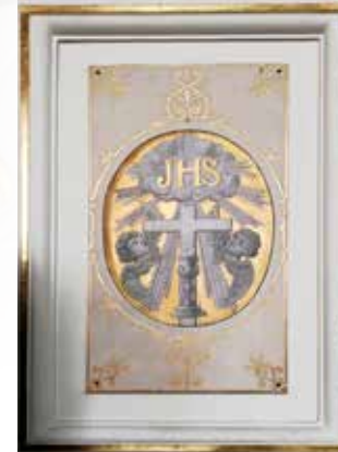
Grisailles Alfons Oosterlinck