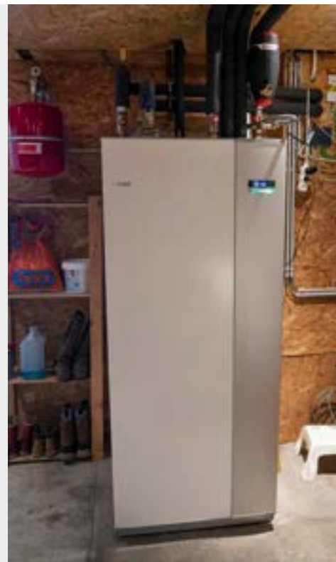
De hybride warmtepomp werd aan de bestaande hoogrendementscondensatieketel gekoppeld.