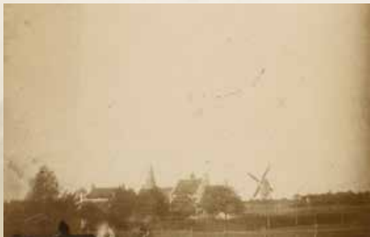
De vermoedelijk oudste foto van de dorpskern van Deurle, met kerk en molen