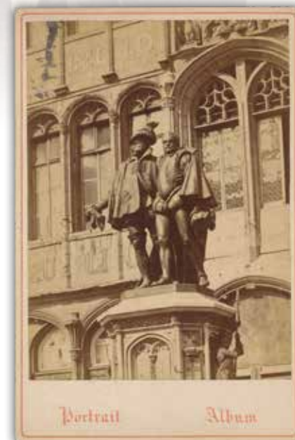
Het standbeeld Horn en Egmont voor het Broodhuis in Brussel, ca.1864.

In 1465 kwam het tot een conflict tussen Jan II en zijn zoon Jan III. Deze laatste werd door zijn vader onterfd en mocht van de koning de naam Montmorency niet meer dragen. In de Franse geschiedenis wordt hij vanaf dan vermeld als Jean de Nivelle (Jan van Nevele). Hij trok vanuit Montmorency (FR) naar Vlaanderen, naar het Land van Nevele en nam zijn intrek op het Kasteel Ooidonk dat door zijn voorouders langs moederszijde was gebouwd.