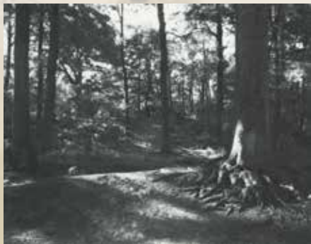
Het oorspronkelijke duinenrelief op de site van het huidige golfterrein