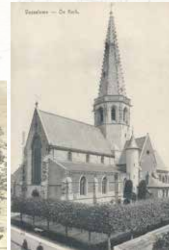
v.l.n.r. Ook vandaag houdt de Maaigemdijk het water tegen Het Meirekasteel in de 16de eeuw, gravure uit A.L. Van Hoorebeke, Notice Historique sur la commune et l'église de Vosselaere, 1846. De Sint-Eligiuskerk omstreeks 1900