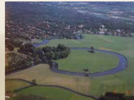
De meander van de Leie, met strategisch het kasteel Ter Laecke op het smalste punt