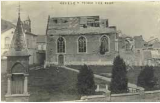
De Sint-Mauritiuskerk van Nevele na de verwoesting in 1918