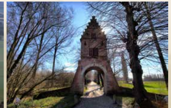
De Blauwe poort