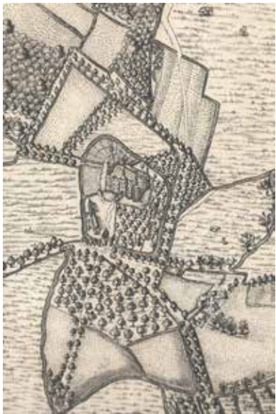
Het kasteel van Ooidonk, detail uit Sanderus, Flandria Illustrata, 1641 Het kasteel van Ooidonk in de 16de eeuw

Het huidige kasteel gaat nog terug op zijn oorspronkelijk grondplan: een vierkant met op de hoeken ronde torens en centraal tussen twee halfronde torens de ingang met ophaalbrug. De naam Ooidonk (Odoncq) wordt tussen de opsomming van heerlijke bezittingen van de familie de Fosseux voor het eerst apart vermeld in 1422, bij het huwelijk van Jan II van Montmorency met Johanna van Fosseux, erfdame van Nevele. Het is hier dat Filips verbleef als hij in deze streek was. Naar uitzicht zien we een luxueuze zomerresidentie die grotendeels teruggaat op de verbouwing van Maarten della Faille (1544–1620), die het in 1592 opkocht van de erfgenamen van Montmorency. De nadruk op wooncomfort en schoonheid – eerder dan op verdediging en veiligheid – werd ook bij de latere 19de-eeuwse verbouwingen voortgezet.