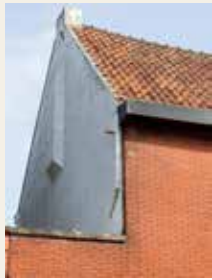
Ziggevel van de vroegere kapel van het penitentenklooster