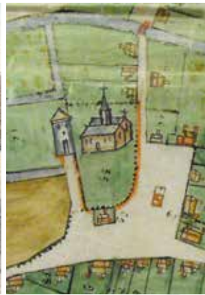
De markt van Nevele in 1908 - Detail met de donjon, de kerk en de markt uit de perceelkaart van Nevele, 1639-40

Kerk en donjon behoorden oorspronkelijk tot hetzelfde domein, wat van de kerk waarschijnlijk een zogenaamde 'eigenkerk' maakte, waar de heer van Nevele de priester aanduidde en de inkomsten van kreeg.