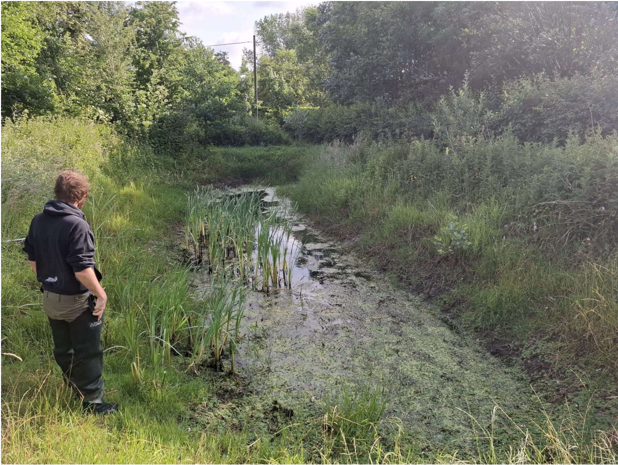
Figuur 14 Poel met onderaan duidelijk zichtbaar waterviolier (foto: Elke Roels, 06/06/2025).

Beschrijving van de omgeving: Deze poel ligt in een verruigd grasland waarop de eigenaars inheemse bomen aangeplant hebben. Er zijn nog bomenrijen van populieren en wilg voornamelijk rondom het perceel om het af te bakenen. Aan de noord- en westzijde sluit het perceel aan op de baan. Aan de westzijde ligt deels jong loofbos en deels permanent cultuurgrasland.