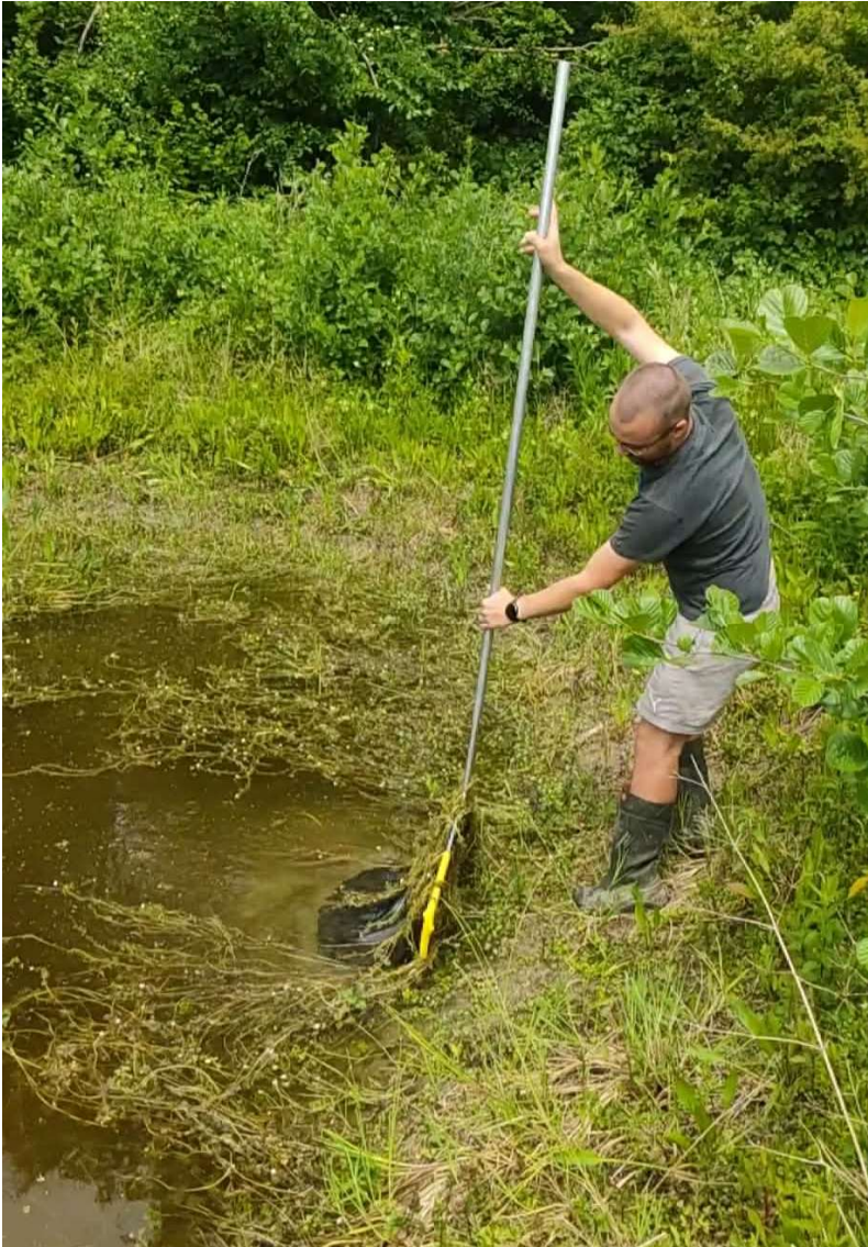
Figuur 2 Tijdens de derde inventarisatieronde worden alle locaties op een gestandaardiseerde manier met een schepnet bemonsterd.