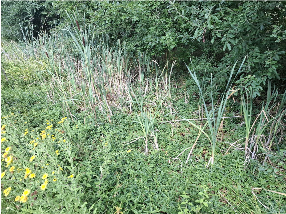
Figuur 18 Volledig verlande poel overgroeid met Grote lisdodde en Moeraswederik (foto: Elke Roels, 07/08/2025).

Beschrijving van de omgeving: Deze poel ligt in dezelfde tuin als de vorige. Voor de beschrijving van de omgeving verwijs ik dan ook naar §4.13.