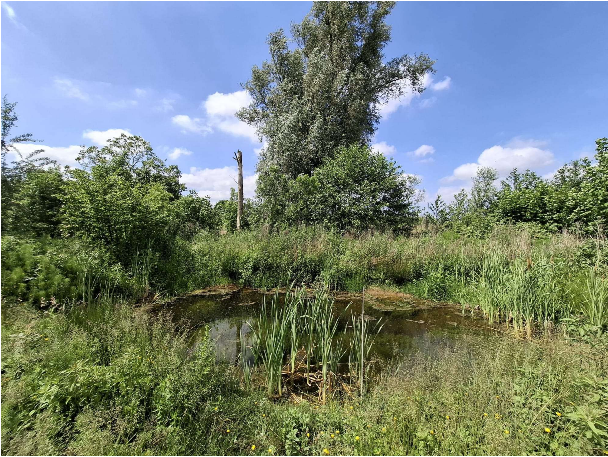
Figuur 16 Poel in verruigd grasland.

Beschrijving van de omgeving: Dit perceel werd in 2003 nog gekarteerd als alluviaal elzen-essenbos gedomineerd door aanplant van Populier maar het overgrote deel van het bos is ondertussen verdwenen. De eigenaar is het bestand aan het heraanplanten met inheemse boomsoorten. De poel bevindt zich in een verruigd grasland in het westen van het perceel. Aan de noordzijde vormt een bomenrij de grens met akkerpercelen.