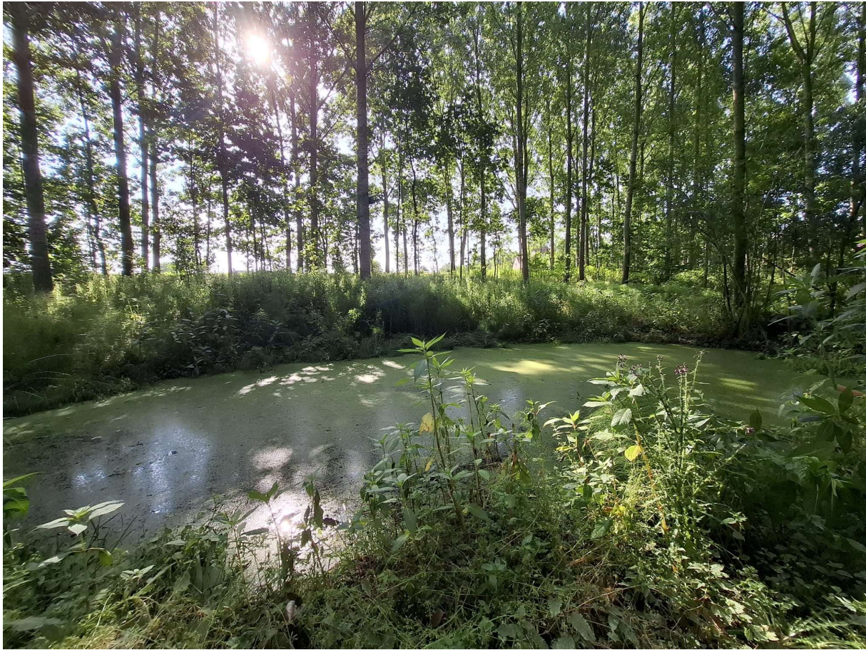
Figuur 19 Bronpoel in populierenbestand (foto: Elke Roels, 09/07/2025)

Beschrijving van de omgeving: Deze poel ligt ten midden van een populierenbestand met een ondergroei van ruigtekruiden. Het is een bestand met vrij vochtige bodem dat sterk afhelt van oost (kant begrensd door akkers) naar west (kant begrensd door de Molenbeek). Aansluitend in het noorden en zuiden gaat het bestand over in alluviaal elzen-essenbos. In het noordelijke bosperceel bevindt zich nog een poel die geruimd werd in 2024.