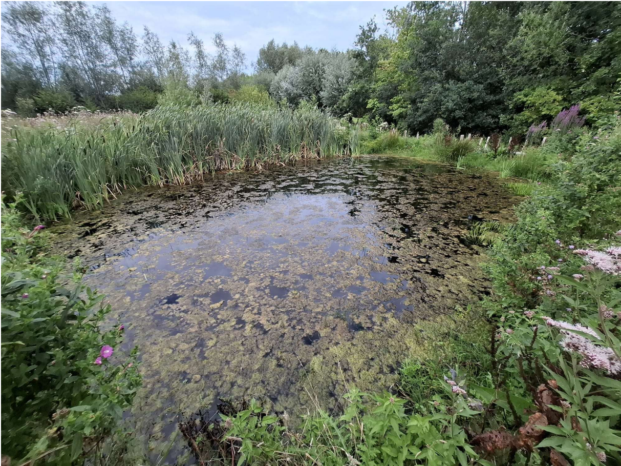
Figuur 17 Zonnige poel op privédomein met sterk ontwikkelde vegetatie (waarschijnlijk deels aangeplant).

Beschrijving van de omgeving: Deze tuin is een combinatie van wilde en ingezaaide inheemse planten, een boomgaard en een moestuin. Tussen verschillende perkjes liggen knuppelpaden en gemaaide wandelstroken. Er zijn twee poelen op dit perceel waarvan deze de grootste is. Het grenst aan soortenarm permanent cultuurgrasland met ook twee poelen. De percelen worden gescheiden door bomenrijen (wilg).