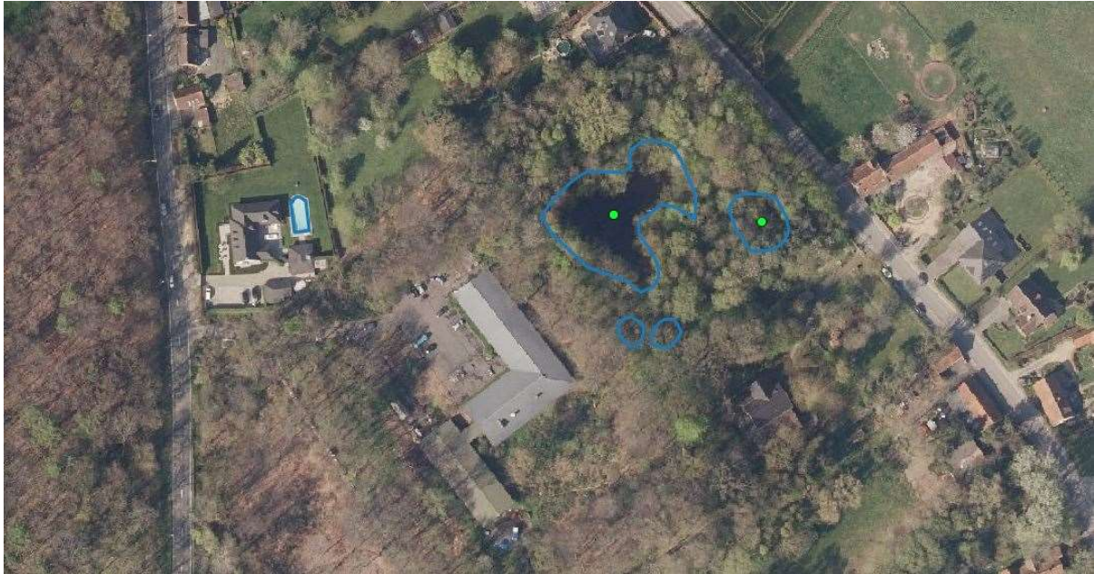
Figuur 4 Achter de gebouwen van ForNaLab bevinden zich vier poellocaties (één grotere, drie kleinere). De meest rechtse poel op de kaart wordt hier besproken.