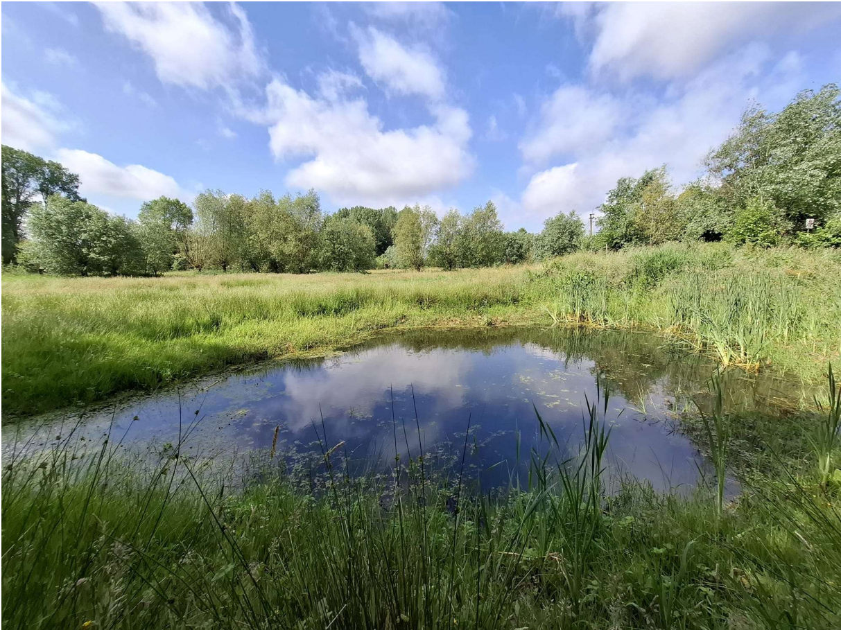
Figuur 6 Situatie zoals die eruit zag eind mei, later is de hoeveelheid kroos nog toegenomen (foto: Elke Roels, 30/05/2025).

Beschrijving van de omgeving: Ook dit perceel is onderdeel van natuurgebied de Gondebeekvallei en werd gekarteerd als soortenrijk permanent cultuurgrasland met goed ontwikkelde houtkanten gedomineerd door wilgen. Langs de zuidzijde van het grasland stroomt de Gondebeek. Op de gelijkaardige graslanden ten westen van onderzochte poel bevinden zich nog twee poelen (figuur 7).