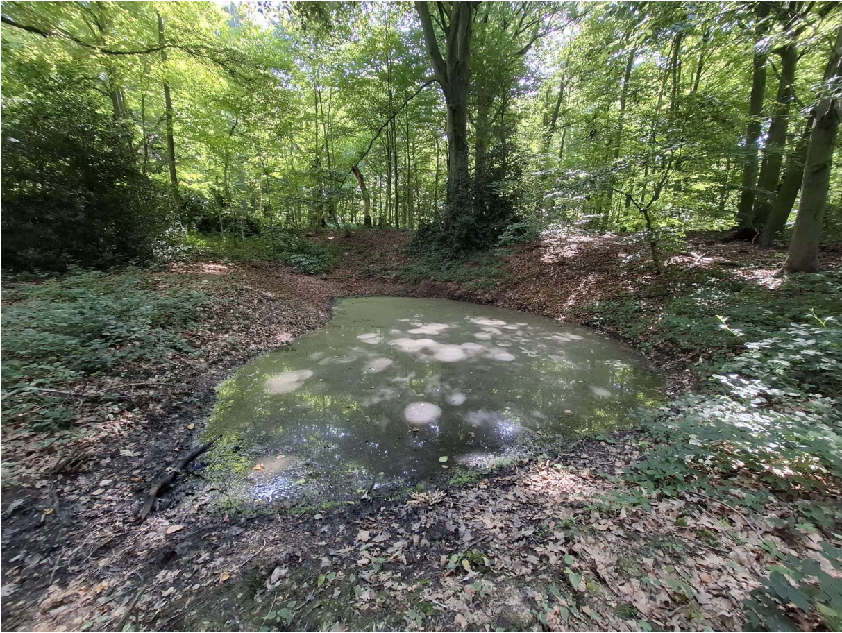
Figuur 9 Kleinste van de twee bospoelen in dit oude bosbestand (foto: Elke Roels, 12/08/2025).

Beschrijving van de omgeving: Deze bospoel ligt in het westelijke deel van het Betsbergbos. Dit perceel staat gekarteerd als een biologisch zeer waardevol eiken-haagbeukenbos en is onderdeel van het Habitatrictlijngebied 'Bossen van het zuidoosten van de Zandleemstreek'. In dit oude bosbestand is een groot aandeel staand en liggend dood hout aanwezig en wordt de ondergroei gekenmerkt door typische voorjaarsbloeiers (vb. Bosanemoon). Vlakbij deze poel bevindt zich nog een andere grotere bospoel.