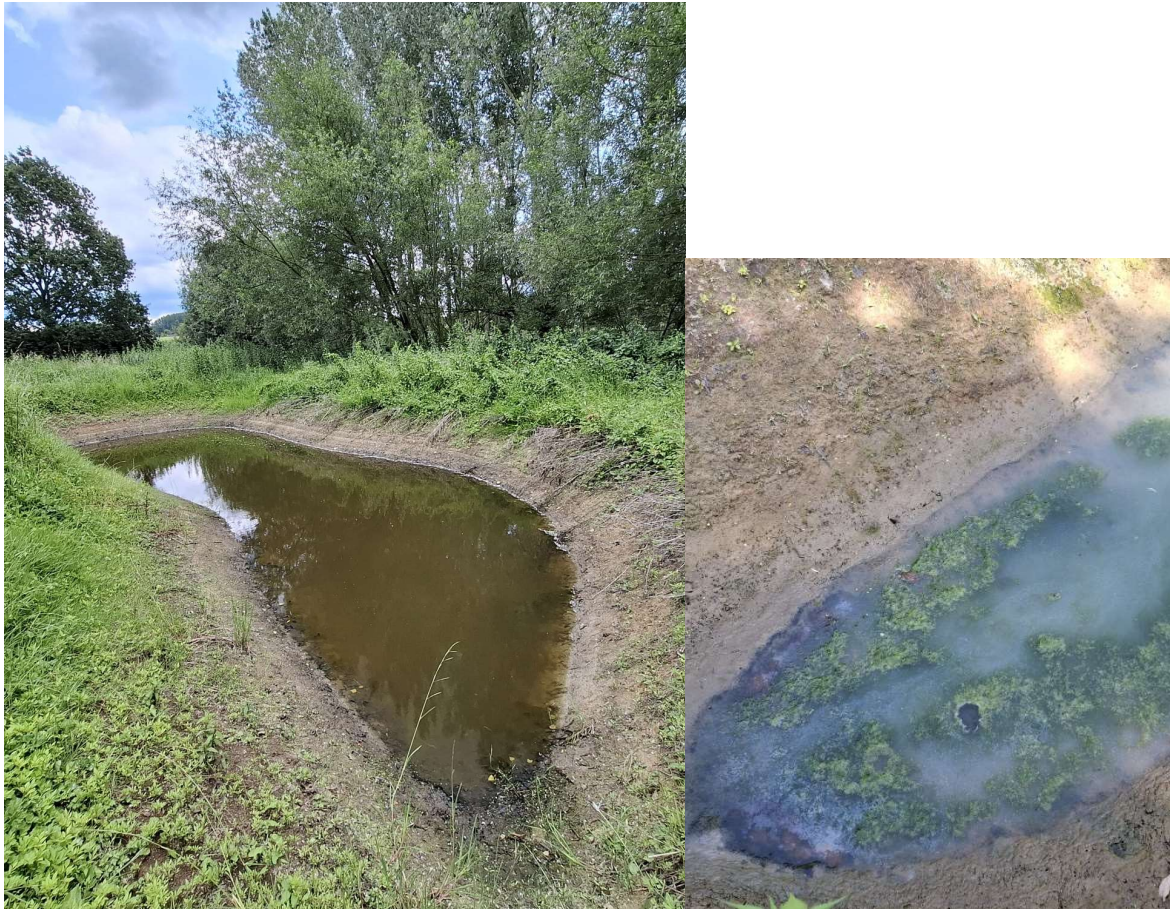
Figuur 21 Links een foto van de poel getrokken op 06/06/2025. Rechts een detail van het water op 12/08/2025 waarop duidelijk te zien is dat de waterkwaliteit sterk achteruit is gegaan

Beschrijving van de omgeving: Dit perceel staat niet langer gekarteerd als dotterbloemgrasland maar als natte strooiselruigte omgeven door wilgenstruweel en nitrofiel alluviaal elzenbos. Net ten noorden ligt de (lokaal) belangrijke voortplantingspoel van alle amfibieën die worden geregistreerd tijdens de overzetactie langsheen de Landskoutersesteenweg. Verder aan de zuidkant stroomt de Molenbeek.