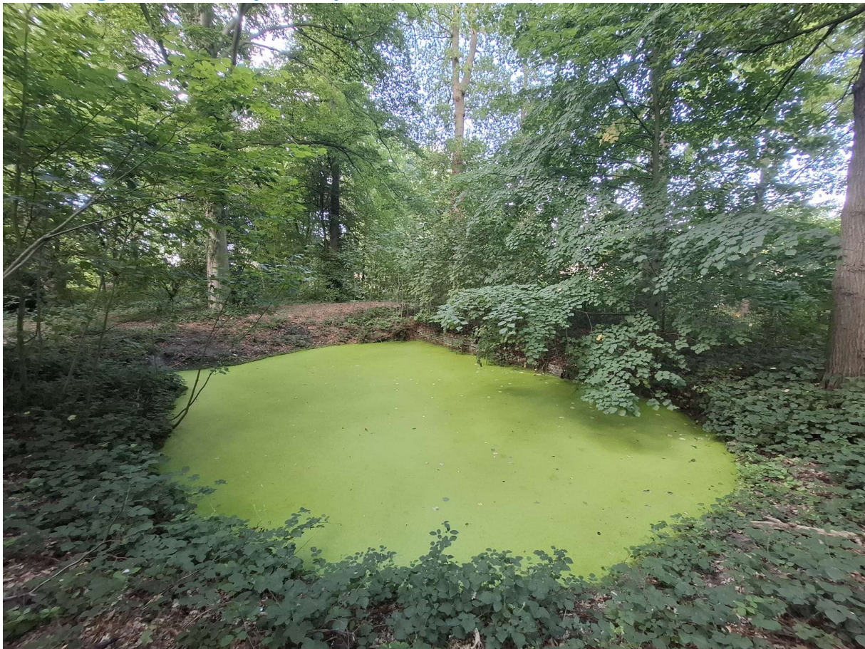
Figuur 11 Meest noordelijke van twee bronpoelen in dit bosbestand (foto: Elke Roels, 07/08/2025).

Beschrijving van de omgeving: Deze bospoel ligt aan de zuidrand van het domein van Borgwal. Op de Biologische Waarderingskaart wordt dit deel van het kasteeldomein gekarteerd als een biologisch zeer waardevol zuur eikenbos. De poel is geconnecteerd met de zuidelijke bospoel via een verbindingsgracht. Beide poelen worden gevoed door eenzelfde bron. Het bosbestand is aan de zuidrand omgeven door een hoge historische omheiningmuur, waardoor deze locatie goed gebufferd lijkt tegen externe negatieve invloeden.