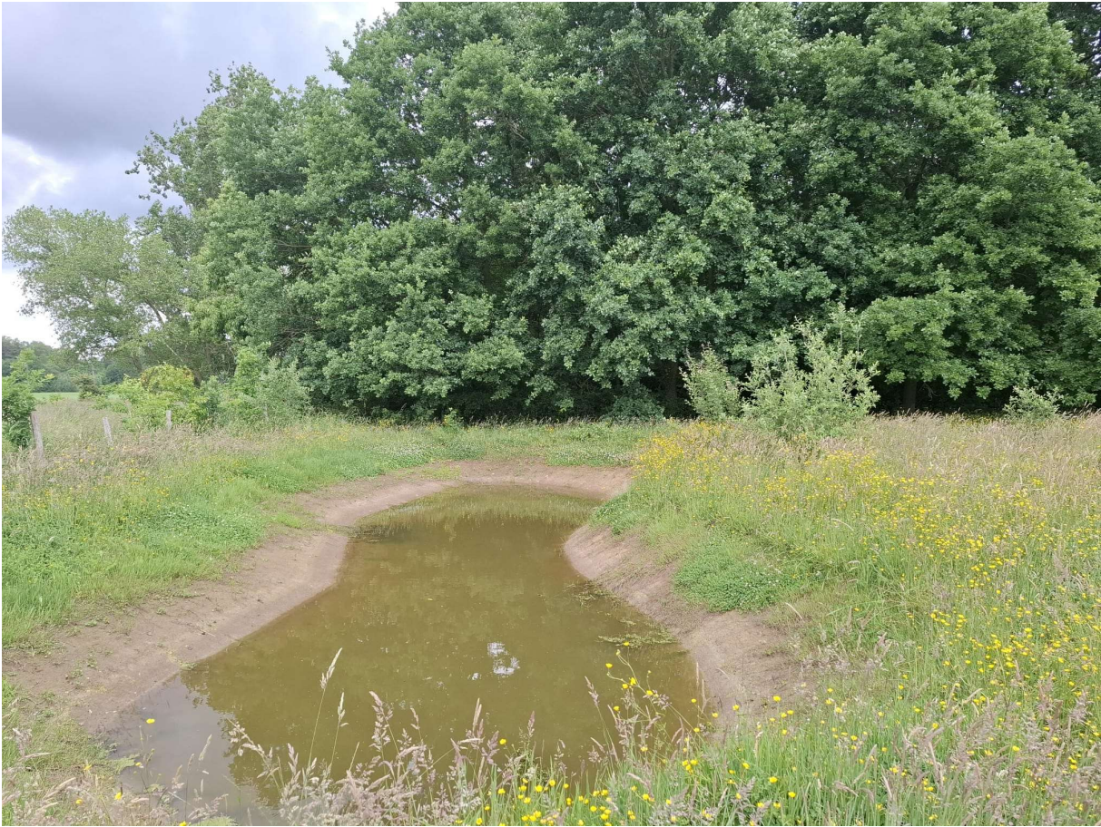
Figuur 13 recente poel met nog weinig oevervegetatie (foto: Elke Roels, 28/05/2025).

Beschrijving van de omgeving: Het perceel staat gekarteerd als biologisch waardevol soortenrijk permanent cultuurgrasland. De poel ligt in de meest noordelijke hoek van het perceel vlak naast bosbestand bestaande uit gemengd loofwoud en Lork. Aan de overige zijden is het grasland begrenst door een akker (westen) en een talud dat dienst doet als kapvlakte (zuidoosten).