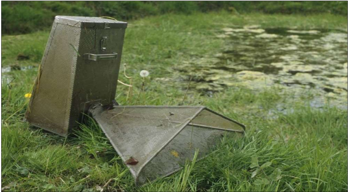
Figuur 1 Tijdens de eerste en tweede inventarisatieronde worden de poelen bemonsterd met amfibieënfuiken.