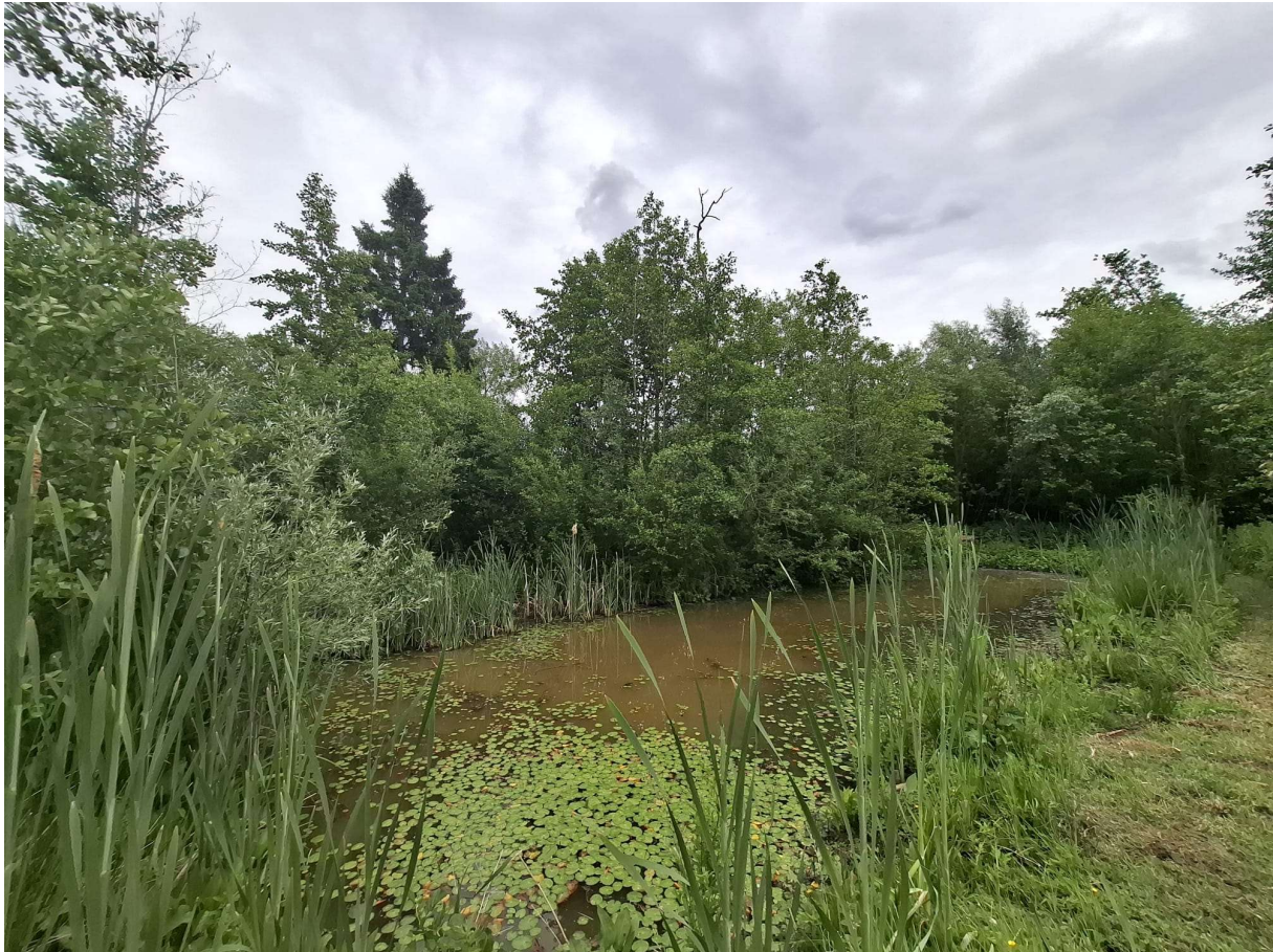
Figuur 8 Poel met veel vegetatie en bruine kleur door infiltratie van verontreinigd beekwater.

Beschrijving van de omgeving: De poel ligt net ten oosten van de Molenbeek. Het perceel waarop deze poel werd uitgegraven, werd in 2003 gekarteerd als een biologisch zeer waardevol alluviaal elzenessenbos. Ondertussen werd het bos deels gekapt en de poel werd aangelegd in 2017.