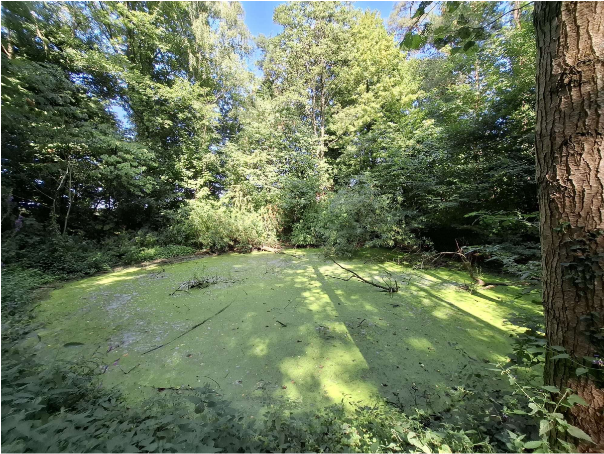
Figuur 3 Met kroos bedekte bospoel (foto: Elke Roels, 12/08/2025).

Beschrijving van de omgeving: De bospoel situeert zich in het oostelijke deel van het Aelmoeseneiebos. Dit boscomplex in Merelbeke-Melle en Oosterzele valt grotendeels in het Habitatrichtlijngebied 'Bossen van het zuidoosten van de Zandleemstreek' maar het bestand waarin deze poel zich bevindt, valt hier net buiten. De nabijheid van een Natura 2000-gebied met zure eikenbeukenbossen, elzenbroekbossen, natte ruigtes en soortenrijke hooilanden staat alvast garant voor voldoende geschikt landhabitat voor amfibieën. De omgeving nabij de poellocatie wordt gekarteerd als eiken-haagbeukenbos, zuur eikenbos en zuur beukenbos en grenst in het westen aan de site van ForNaLab, een wetenschappelijke onderzoeksinstituting van de Universiteit Gent. Op dit perceel liggen nog drie andere poelen waarvan een heel grote bospoel en twee kleinere poeltjes (figuur 4).