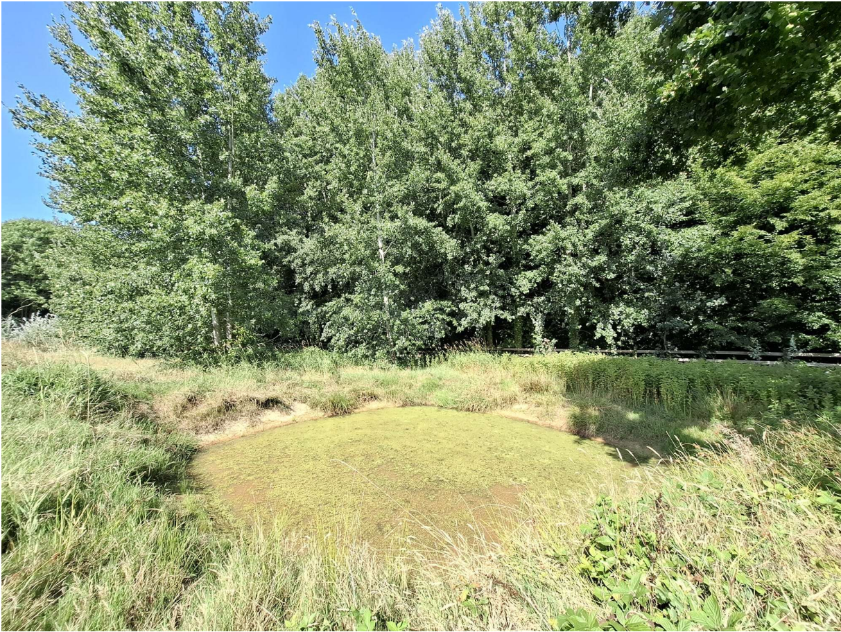
Figuur 10 Zonnige poel aan de rand van een oud bosbestand (foto: Elke Roels, 12/08/2025).

Beschrijving van de omgeving: Het perceel waarin de poel ligt, grenst in het noorden aan het Betsbergbos. Dit bos maakt integraal deel uit van het Vlaams Ecologisch Netwerk en is Europees beschermd als onderdeel van het Natura 2000-habitatrichtlijngebied 'Bossen van het zuidoosten van de Zandleemstreek'. Het Betsbergbos is 14 hectare groot en werd in mei 2018 gekarteerd als een overwegend zuur beukenbos met een eiken-haagbeukenbos in het noordelijke gedeelte. Het is een oud bos dat al zeker sinds 1770 bestaat. Aan de zuidrand wordt het poelperceel begrensd door een soortenarm permanent cultuurgrasland.