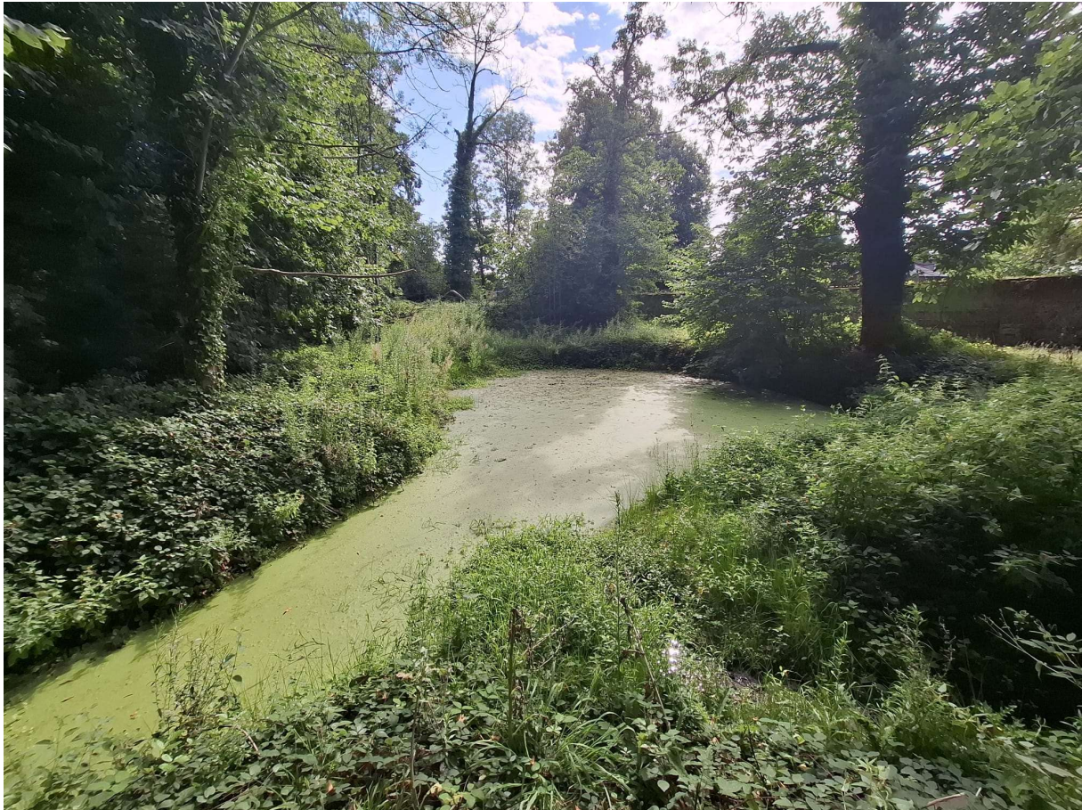
Figuur 12 Bronpoel aan de rand van het bosbestand, de poel gaat over in een gracht (linksonder) die in verbinding staat met poel 7 (07/08/2025).

Beschrijving van de omgeving: Deze bospoel ligt aan de zuidrand van het domein van Borgwal. Op de Biologische Waarderingskaart wordt dit deel van het kasteeldomein gekarteerd als een biologisch zeer waardevol zuur eikenbos. De poel is geconnecteerd met de noordelijke bospoel via een verbindinggracht. Beide poelen worden gevoed door eenzelfde bron. Het bosbestand is aan de zuidrand omgeven door een hoge historische omheiningmuur, waardoor deze locatie goed gebufferd lijkt tegen externe negatieve invloeden.