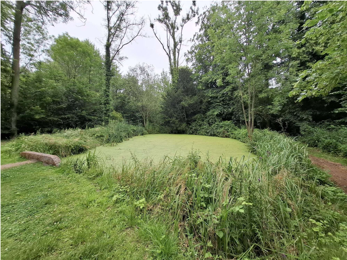
Figuur 20 Met kroos bedekte poel in oude pastorijtuin. Links van het bruggetje op de foto ligt nog een kleinere poel die overloopt in deze poel (niet zichtbaar op foto) (foto: Elke Roels, 24/06/2025).

Beschrijving van de omgeving: De poel ligt in de grote tuin van de voormalige pastorie van Moortsele en wordt in het noorden begrensd door een bosbestand dat werd gekarteerd als een biologisch zeer waardevol nitrofiel alluviaal elzenbos, in het zuiden door een alluviaal elzen-essenbos, beide met ingeplante populieren. Uitlopers van deze bosbestanden vormen de grens tussen de zuidoostkant van de poel en de Molenbeek. Net ten westen van de grote poel ligt een kleinere poel die afwatert naar de grote poel.