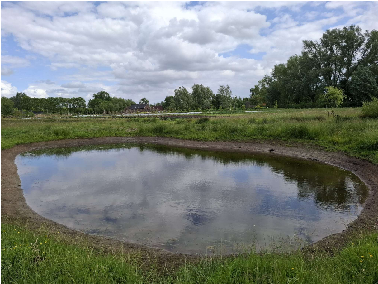
Figuur 15 Recent gegraven poel waarbij oeervegetatie nog ontbreekt (foto: Elke Roels, 28/05/2025).

Beschrijving van de omgeving: Deze locatie ligt in een perceel dat werd gekarteerd als een biologisch waardevol soortenrijk permanent cultuurgrasland. In het noorden wordt het perceel begrensd door een nitrofiel alluviaal elzenbos, in het westen wordt het door een hoge historische omheiningmuur gescheiden van het kasteeldomein Borgwal. Ten zuiden en oosten liggen de percelen van de bioboerderij met grasland, groenten, kruiden, bloemen en fruitbomen.