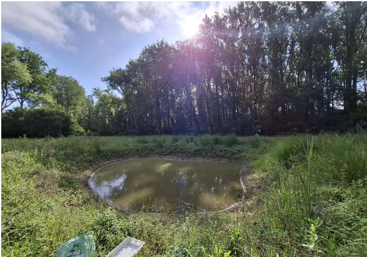
Figuur 5 Na dit bezoek in mei is het waterpeil nog sterk gezakt (foto: Elke Roels, 30/05/2025).

Beschrijving van de omgeving: Het perceel waarop deze poel zich bevindt is onderdeel van natuurgebied de Gondebeekvallei en werd gekarteerd als een moerasspirearuigte met elementen van dotterbloemgraslanden. In het zuiden grenst het perceel aan een alluviaal elzen-essenbos met aangeplante populieren (onderdeel van het Aelmoeseneiebos) en langs de noordzijde stroomt de Gondebeek. Dit perceel wordt zo min mogelijk actief beheerd en vormt een rustplaats voor broedende dieren.