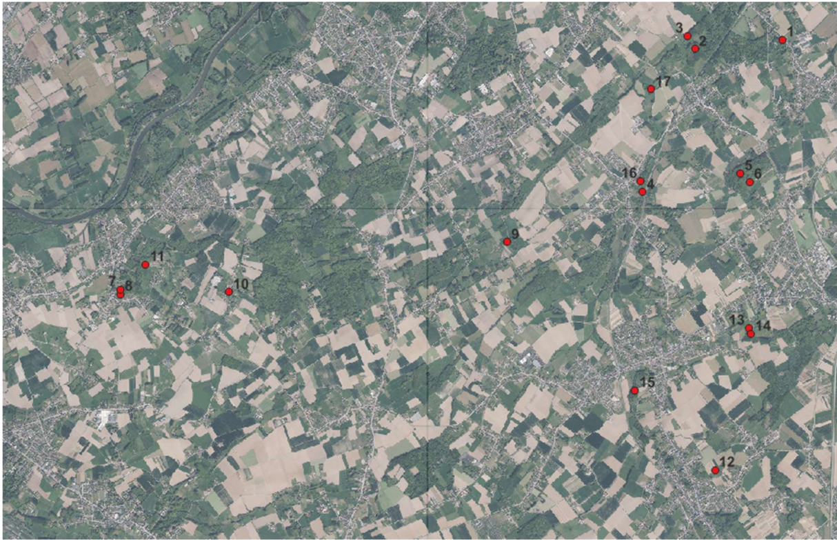
Figuur 22 Overzicht van de poellocaties die gemonitord zijn in 2025.