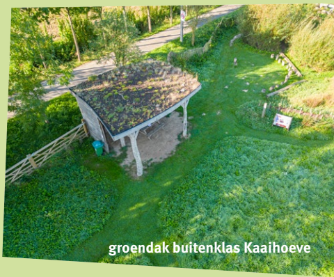
groendak buitenklas Kaaihoeve

Een groendak of vegetatiedak is een plat of (licht) hellend dak bedekt met substraat waarin planten groeien . Afhankelijk van de dikte van de substraat laag en de soort beplanting spreken we van een intensief of extensief groendak. Een extensief groendak heeft een dunne laag substraat (max. 15 cm) en een lage begroeiing van vetplanten, kruiden en grassen. Een intensief groendak is dikker en zwaarder, kan meer water vasthouden en kan naast kruiden en grassen ook struiken en zelfs bomen bevatten. Het is ook vaak toegankelijk voor gebruik als tuin of terras, terwijl een extensief groendak enkel toegankelijk is voor een halfjaarlijkse onderhoudsbeurt.