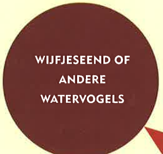
WIJFJESEEND OF ANDERE WATERVOGELS