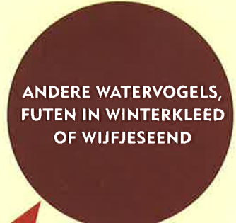
ANDERE WATERVOGELS, FUTEN IN WINTERKLEED OF WIJFJESEEND