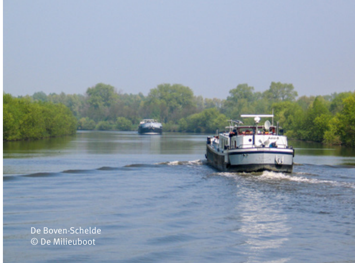
De Boven-Schelde

De onbevaarbare waterlopen zijn de kleinere rivieren of kanalen, maar kunnen ook beken met een beperkte breedte zijn.