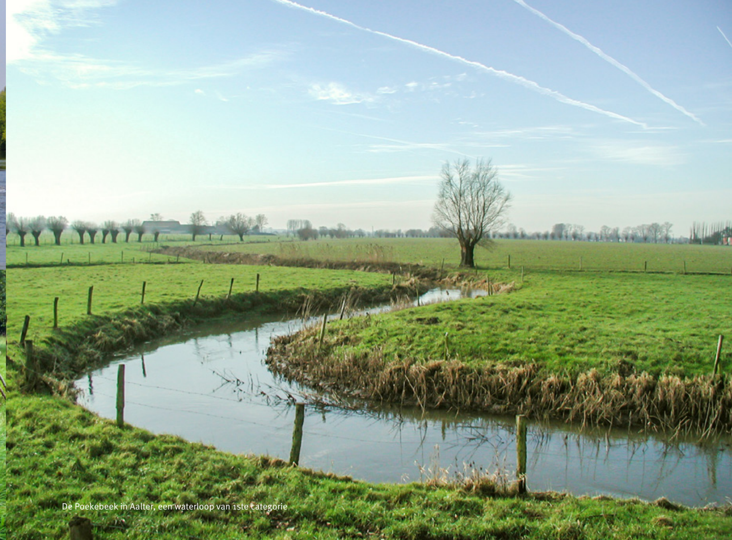
De Poekebeek in Aalter, een waterloop van 1ste categorie