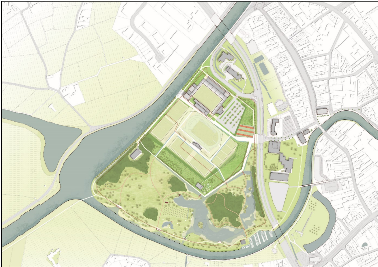
Eindbeeld van het voorkeursscenario

Het PRUP zal enkel de hoofdlijnen van het voorkeursscenario juridisch vastleggen.