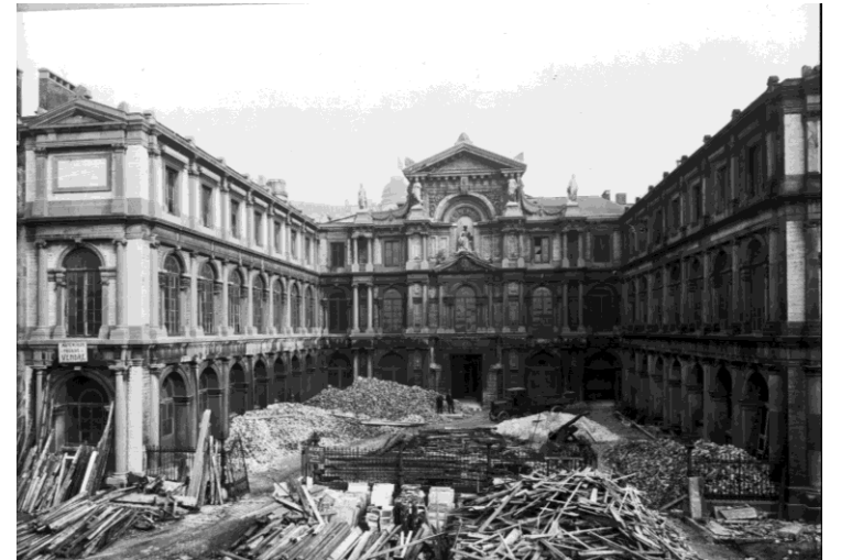
Afbraak van het Palais Granvelle, 1930