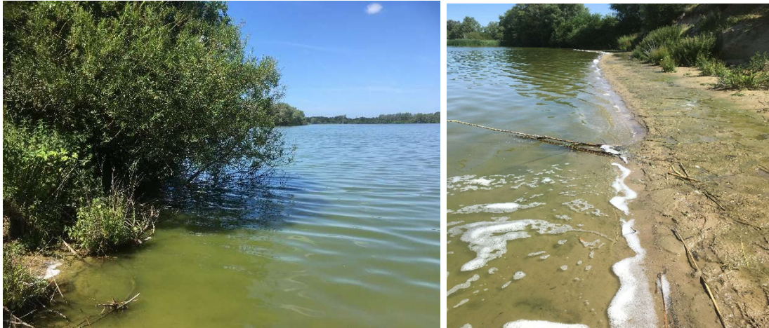
Figuur 3 – drijflagen van blauwalg op Roksem put, foto genomen op 22/06/2020.

Een algemene observatie bij het visonderzoek was dat het oppervlak van de Roksem put nagenoeg volledig bedekt was met dikke drijflagen van blauwalg (figuur 3). Tijdens het varen van de ene locatie naar de andere konden we vaststellen dat zelfs in het middengedeelte van de Roksem put blauwalgen in grote getale voorkwamen en vlokken vormden. De drijflagen kwamen niet enkel voor aan de oevers waar de wind overheersend naar blies, maar ook aan alle andere oevers.