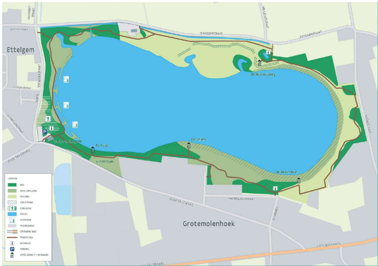
Figuur 1 – kaart met aanduiding recreatiemogelijkheden en ligging.

Hieronder wordt het studiegebied op kaart en op luchtfoto weergegeven. De plas is veertig hectare groot en bevat zowel diepe (9 meter) als ondiepe zones inclusief enkele moeraszones.