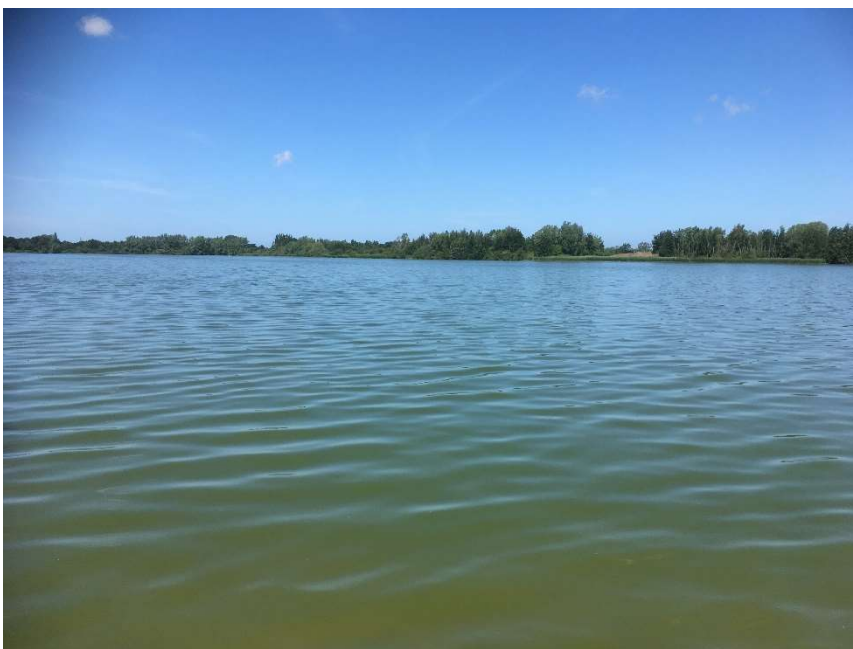
Foto: zicht op de wijde oppervlakte van Roksem put. Foto genomen op 22/06/2020

De Hoge Dijken, ook gekend onder de naam Roksem Put, is een Vlaams natuurreservaat dat door het Agentschap Natuur en Bos (ANB) wordt beheerd. De naam "Hoge Dijken" refereert naar de historische situatie van het gebied, dat ooit gekenmerkt werd door hoge zandduinen. Bij de aanleg van het autosnelwegtraject tussen Jabbeke en Veurne werd hier het benodigde zand gewonnen waardoor de duinen verdwenen en een zandwinningsplas ontstond. Het volledige reservaat is 52 hectare groot waarvan ruim 40 hectare bestaat uit de bewuste zandwinningsplas. De plas kent een gevarieerde oeverstructuur met zowel steile wanden die fungeren als broedkolonie voor oeverzwaluw, als moeraszones met riet en hier en daar wilgenstruweel. Ook het bodemprofiel van de plas is zeer gevarieerd met dieptes tot ongeveer 9 meter afgewisseld met ondiepe zones. De bodem bestaat overwegend uit zand.