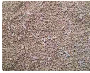
Foto: Pellets van steekvast ijzerslib gebruikt als filtermateriaal voor fosfor

Foto 5 (links) en Foto 6 (rechts) - Bron foto's en meer info: http://www.waterportaal.be