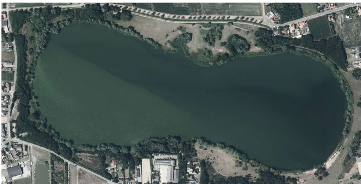
Figuur 2 – luchtfoto (2015; www.geopunt.be ).