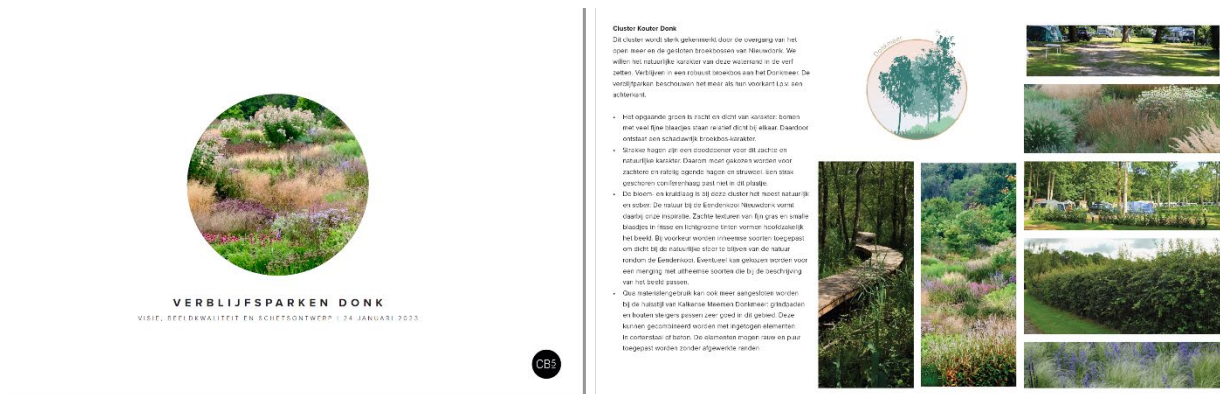
Figuur 2.1: Foto van werkatelier tijdens ontwerptraject (boven) en het beeldkwaliteitsplan (onder)

Er werd tijdens dit ontwerptraject ook een beeldkwaliteitsplan opgemaakt waarin ruimtelijke en ontwerp- principes, goeie voorbeelden, referentiebeelden,... voor de inrichting van een camping of verblijfpark werden gebundeld. Dit werd verspreid onder de uitbaters en kan dienen als inspiratiegids voor de verblijfparken voor kleine inrichtingen zoals groenaanleg, aanleg paden,... tot grotere werken op de parken. Waar mogelijk en relevant worden deze principes ook doorvertaald in dit RUP.