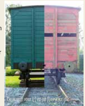
De wagon voor (r) en na (l) restauratie.

Een inspectie van Monumentenwacht Oost-Vlaanderen vestigde de aandacht op de toen slechte staat van dit erfgoed op wielen. Ze zochten een oplossing. In het schooljaar 2023–2024 restaureerden leerlingen van Richtpunt campus Ninove-Zottegem de wagon. De richtingen 'binnenschrijnwerk en interieur' en 'carrosserie en spuitwerk' zetten hun beste beentje voor, onder deskundige begeleiding van de provinciale diensten Monumentenwacht en Patrimonium en een gespecialiseerde aannemer. Ze bewaarden zoveel mogelijk authentiek materiaal, want die onderdelen onthullen niet enkel de levensloop van de wagon, ze bevatten ook DNA van getransporteerde mensen. De wagon kreeg zijn oorspronkelijke groene kleur terug en het identificatienummer 295.981 dat hij droeg tijdens de Tweede Wereldoorlog. Al doende leerden de leerlingen zowel over technieken en restauratie, als over de geschiedenis en de verschrikkingen van oorlog. Dankzij hun inspanningen kan dit erfgoed van grote maatschappelijke waarde dit belangrijke verhaal blijven vertellen, iets waar ze met trots op mogen terugkijken.