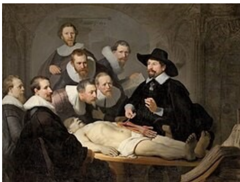
Rembrandt 'De anatomische les van Dr. Nicolaes Tulp'