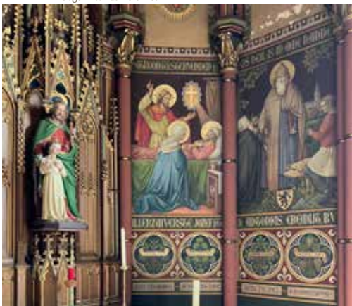
De Sint-Jozefkapel met rechts de muurschildering van de Heilige Antonius Heremiet