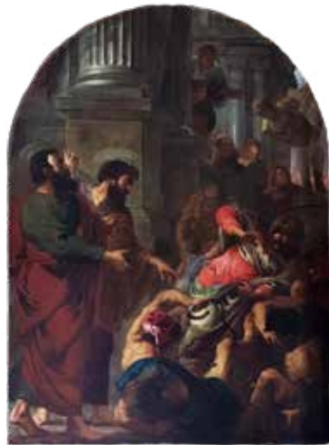
Erasmus Quellinus II, De heiligen Judas Thaddeus en Simon Zelotes bezweren afgodsbeelden