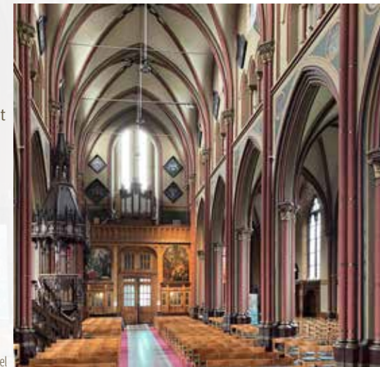
Het interieur van de kerk met het doksaal en orgel

Op het doksaal staat een orgel, gebouwd door de beroemde familie Van Peteghem. Volgens de ene bron zou het dateren uit 1874 en dus gebouwd kunnen zijn voor de huidige nieuwe kerk. Een andere bron houdt de datering op 1853, wat betekent dat het afkomstig zou kunnen zijn uit de oude kerk. Het is in 1926–1927 uitgebreid met onder andere een elektrisch blaastoestel en in 1946 grondig hersteld. In de jaren 1970 raakt het buiten gebruik. Het wordt in 1980 beschermd als monument en in 2000 volledig gerestaureerd door orgelbouwer Dierik Potvlieghe. Daarbij opteert men om de oorspronkelijke toonhoogte, namelijk: a = 406,4 Hertz bij 19^\circ Celsius, te behouden, een bijzonderheid en enkel te horen voor iemand met een absoluut gehoor.