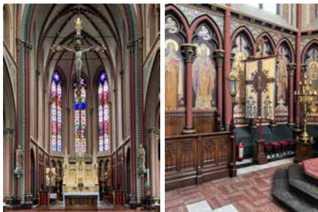
links: Het koor, met triomfkruis, hoofdaltaar en glasramen