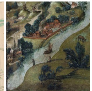
Detail uit het Panoramisch zicht op Gent, 1534 © STAM Gent. De vermoedelijk oudste afbeelding van Gentbrugge, met de kerk linksonder.