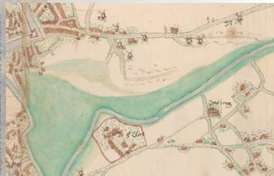
Detail van de kaart van Jacob Van Deventer, 1599 © Nationale Bibliotheek van Spanje. Naast het centrum van Gentbrugge, met kerk, is de omwalde kluis te herkennen.