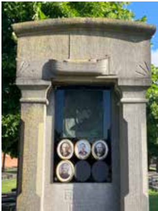
Detail van een schippersgraf, met reliëf van een binnenvaartschip

Opvallend is het aantal graven van schippersfamilies, vaak herkenbaar aan de symboliek, het beeldhouwwerk of de foto van een binnenvaartschip. Dit is mogelijk te verklaren door de unieke ligging van het kerkhof, pal op een Scheldeoever. Het feit dat Sint-Judas Thaddeus in de kerk uitzonderlijk met een schip als attribuut wordt afgebeeld, wijst mogelijk op de bijzondere betekenis die deze plek heeft voor schippers.