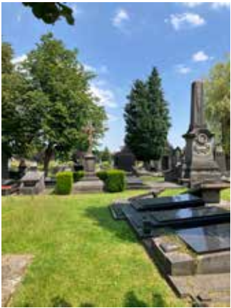
Op het oudste deel van het kerkhof markeert het kruis de plaats van de oude kerk