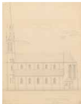
Ferdinand De Noyette, Ontwerp voor de kerk, 1868, Archief KCML