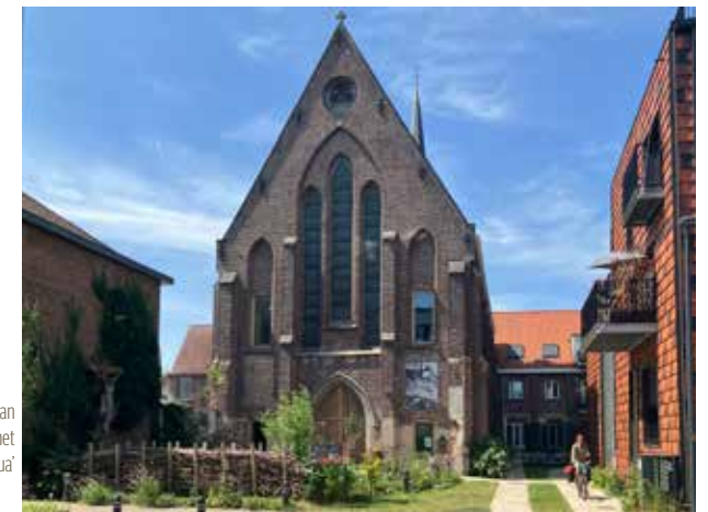
De voormalige Sint-Antonius van Paduakerk is nu onderdeel van het co-housingproject 'Tuin van Padua'

Het altaar, achteraan in de kerk, is afkomstig van de ontwijde kerk van Sint-Antonius van Padua aan de Louis Van Houttestraat. Door de stadsontwikkeling komen steeds meer arbeiders in deze wijk tegen de Keizerpoort wonen. Daarom start men in 1878 met het bouwen van een hulpkerk. Pas in 1965 wordt ze de volwaardige parochiekerk van de nieuwe parochie Sint-Antonius. In 2015 wordt de kerk ontwijd en in 2018 wordt de parochie terug toegevoegd aan deze waaruit ze oorspronkelijk is ontstaan. De heilige Antonius van Padua, patroon van onder andere de armen, maar vooral van de 'verloren voorwerpen' wordt vaak afgebeeld met een lelie en het kindje Jezus.