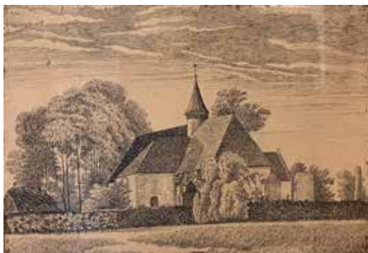
J. De Lange, De oude kerk net voor afbraak in 1871, tekening uit 1920