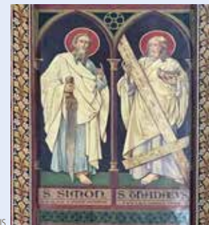
Frans Coppejans, muurschildering in het koor met de heiligen Simon en Judas Thaddeus

Ook Judas wordt met diverse martelwerktuigen voorgesteld, zoals een bijl, knots of hellebaard. Maar er is ook een legende die verhaalt dat hij aan het kruis is gestorven, en daarom vind je hem, zoals in deze kerk, regelmatig terug met een groot kruis in de hand. Hij wordt aangeroepen bij hopeloze zaken. Hun feestdag valt op 28 oktober, ze hebben zelfs een weerspreuk: Als Simon en Judas komen, begint men de winter te schromen .