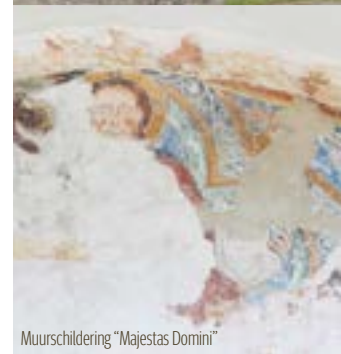
Muurschildering "Majestas Domini"