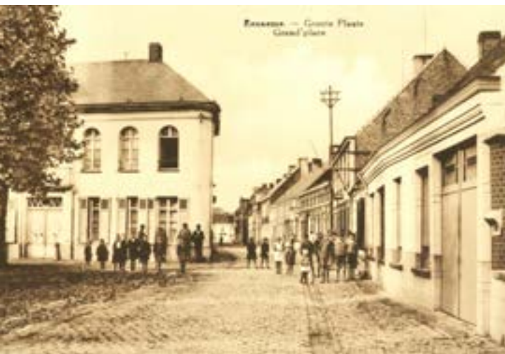
postkaart Huis Beernaert eind 19de eeuw