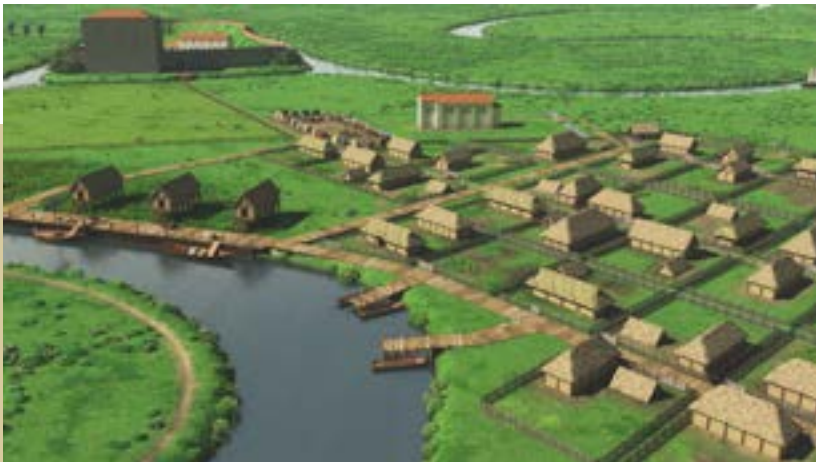
Evocatie van Ename in het jaar 1000

De burcht, hoe sterk die ook was uitgebouwd, zou het niet halen tegen de agressie van de Vlaamse graven. Rond 1050 kwam Ename definitief in handen van Boudewijn V en werd het markgraafschap bij Vlaanderen ingelijfd. Voor Ename begint een nieuw hoofdstuk.