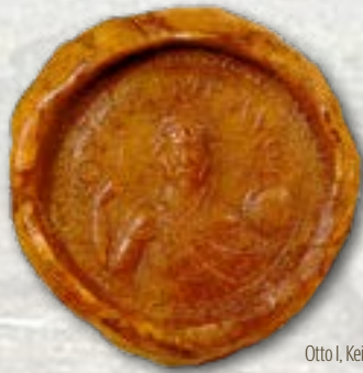
Otto I, Keizerszegel (966), Magdeburg, Landeshauparchiv Sachsen-Anhalt Archeologische opgravingen in de burchtzone (1993)

Ename beleefde een gouden tijd. Rond 1000 kende de plaats zelfs een eclatant hoogtepunt, waarvan de echo tot in de historische bronnen doorklinkt. Lang duurde dit glorieuze moment echter niet. In het midden van de 11de eeuw kwam het markgraafschap Ename dan toch definitief in het bezit van de Vlaamse graaf Boudewijn V. Hij stichtte er samen met zijn echtgenote, de Franse koningsdochter Adela, in 1063 een abdij. In plaats van de hoge adel bepaalden voortaan benedictijnen het leven in Ename tot in 1794, toen de abdij onder het Franse bewind werd afgeschaft.