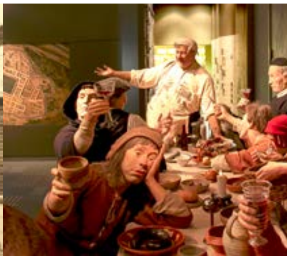
Feest van 1000 jaar